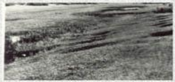
Следы боев на правом берегу Днепра под с. Глушец.