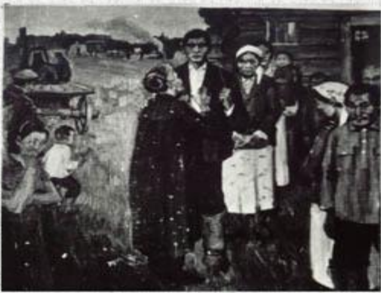
Проводы. Работа худ. Ф.Н. Попова

Покидая отчий дом и родной наслег, Федор оставил о себе в день отъезда память: на живописной поляне неподалеку от родного дома он установил 3-х метровый столб из ствола лиственницы («Кэриэс