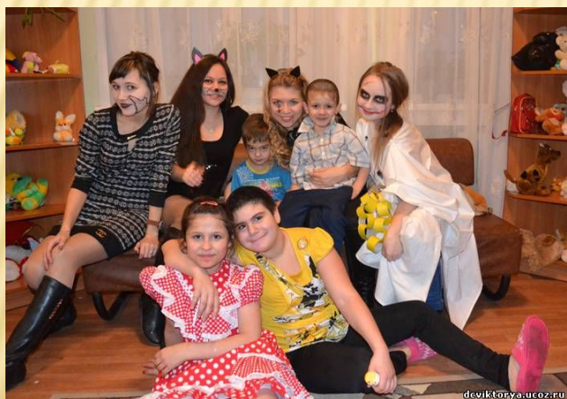
Студенты Новосибирского Государственного Университета Экономики и Управления