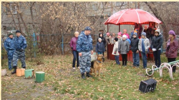
ОДН ЛО МВД России на ст. Новосибирск с совместно с Кинологами