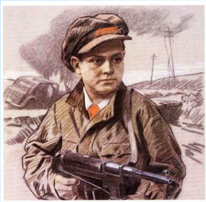
Леня Голиков Казей