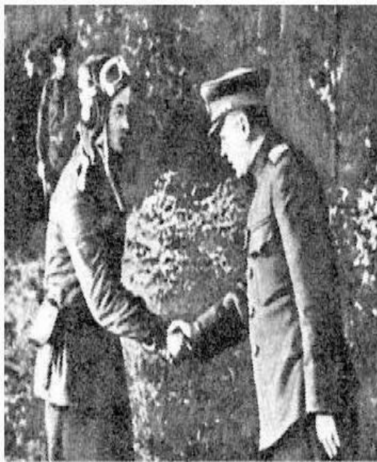
А. А. Новиков поздравляет А. П. Маресьева со сбитым самолётом противника. 1943 год.