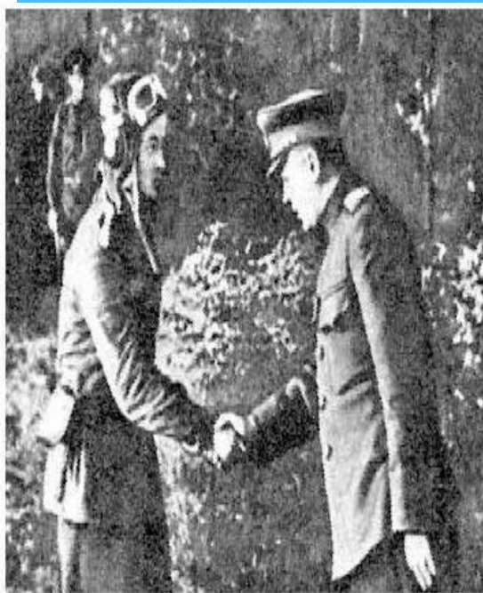
А. А. Новиков поздравляет А. П. Маресьева со сбитым самолётом противника. 1943 год.