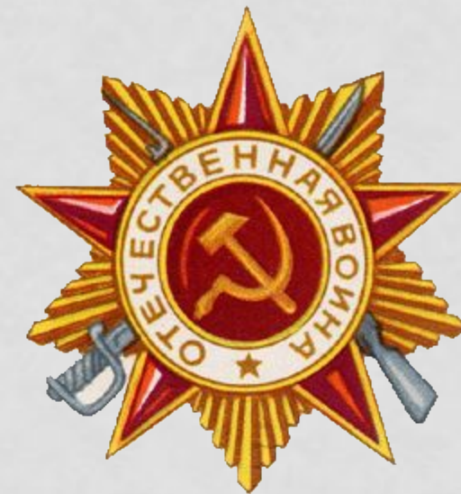
Орден Отечественной Войны"