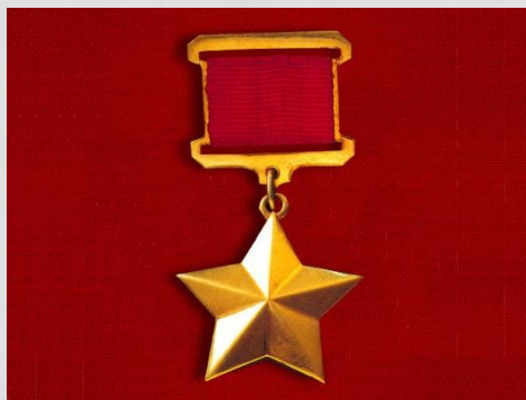
Герой Советского Союза