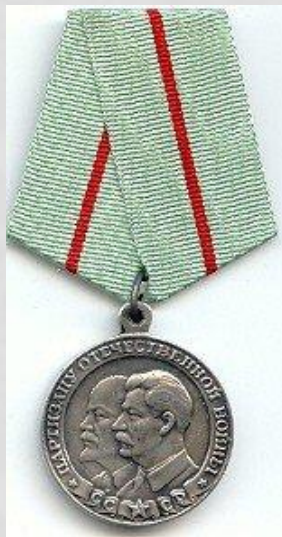
«Партизан Отечественной войны»»

Валентин Александрович Котик – самый юный из тех ребят, которые приняли смерть с оружием в руках. Он погиб как герой в 1944 году. Валя был награждён орденом Отечественной войны 1 степени, медалью «Партизан Отечественной войны» 2 степени. Родина посмертно удостоила его званием Героя Советского Союза.