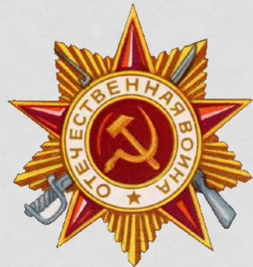
Орден Отечественной Войны"