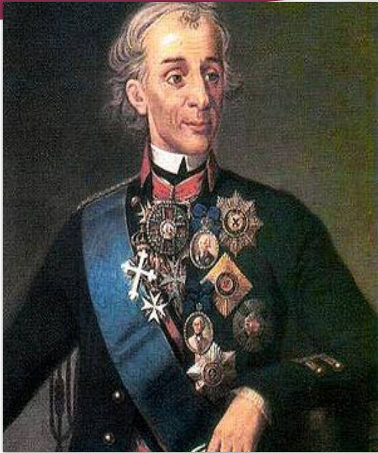
АЛЕКСАНДР ВАСИЛЬЕВИЧ СУВОРОВ 1730-1800