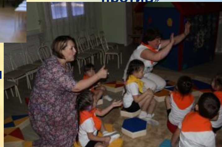
Открытое занятие «Космос» для педагогов Республики