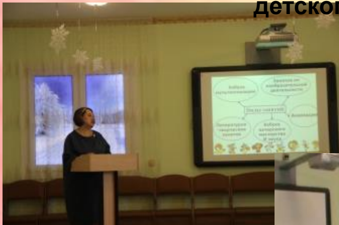
Модульная программа «Школа анимации» 4 место