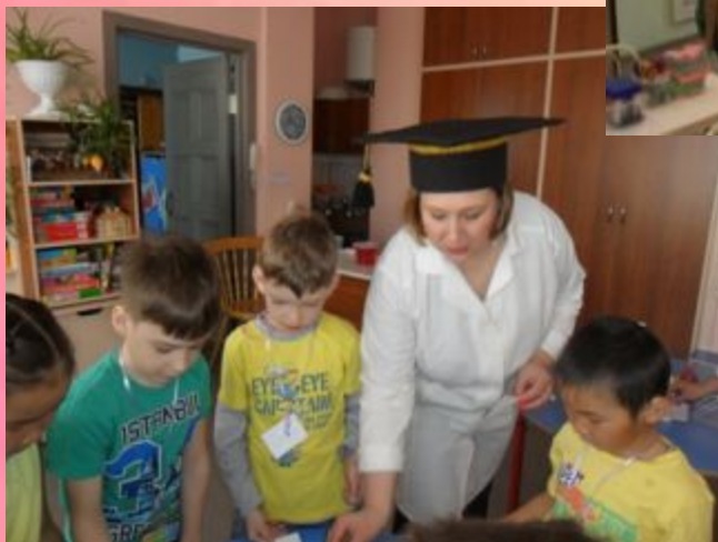
Обмен группами Опытно-экспериментальная площадка