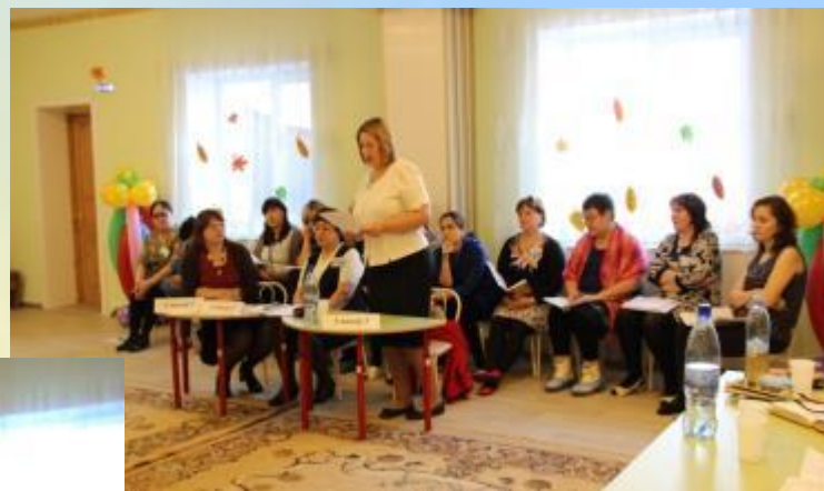
Дебаты с БГУ «Инклюзивное образование – за и ПРОТИВ»