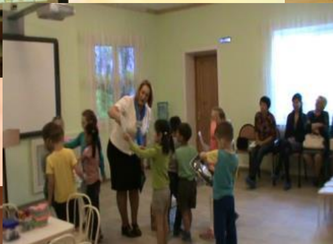
Открытое занятие «Оптические иллюзии»