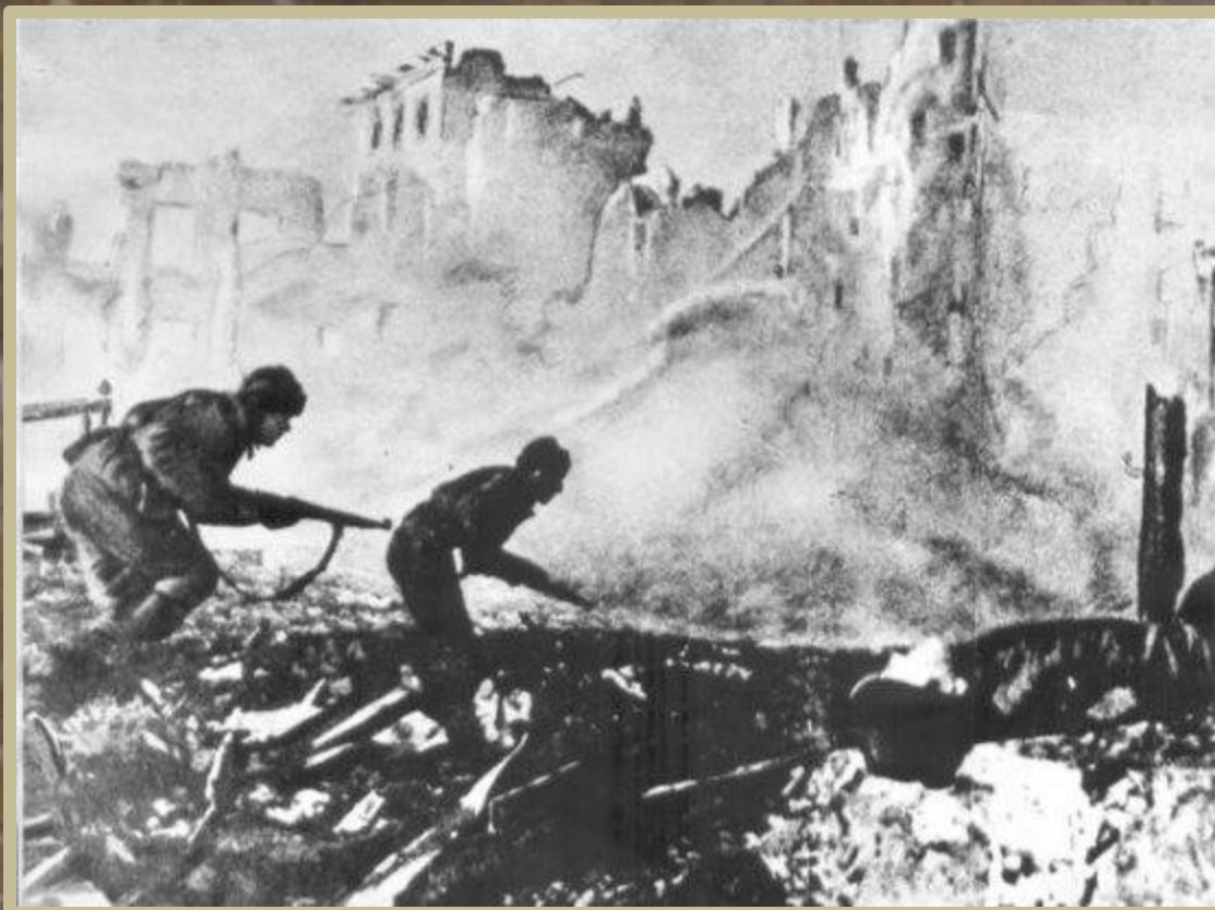
Высота 102.0 «Мамаев курган».