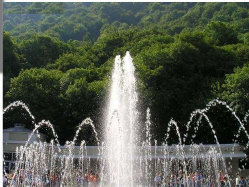
Цветной фонтан в парке

В нем есть два бювета с водой, красивый фонтан,