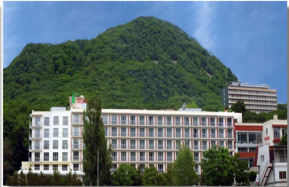
Санаторий им. Э. Тельмана (1907г. постройки)