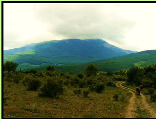
«Дорога на Джайляу» Мейрманов Дамир