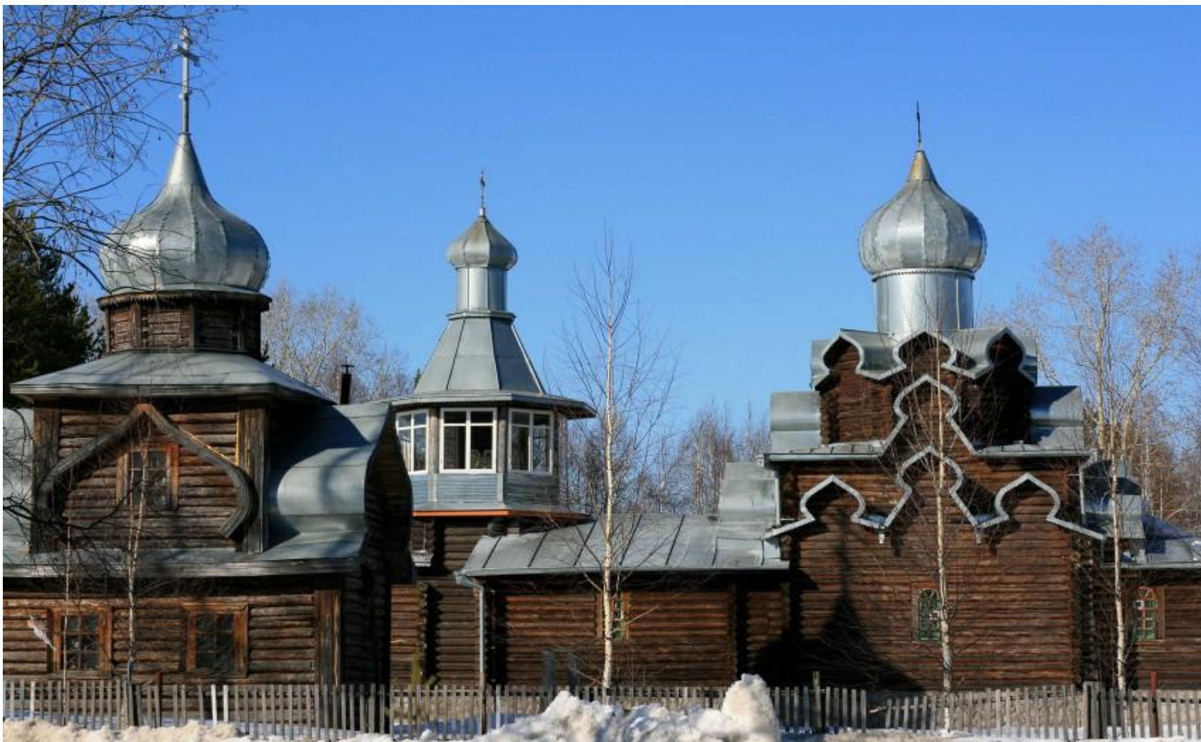
Церковь Успения Пресвятой Богородицы. Емва. Княжпогостский район . Деревянная церковь. Действует.