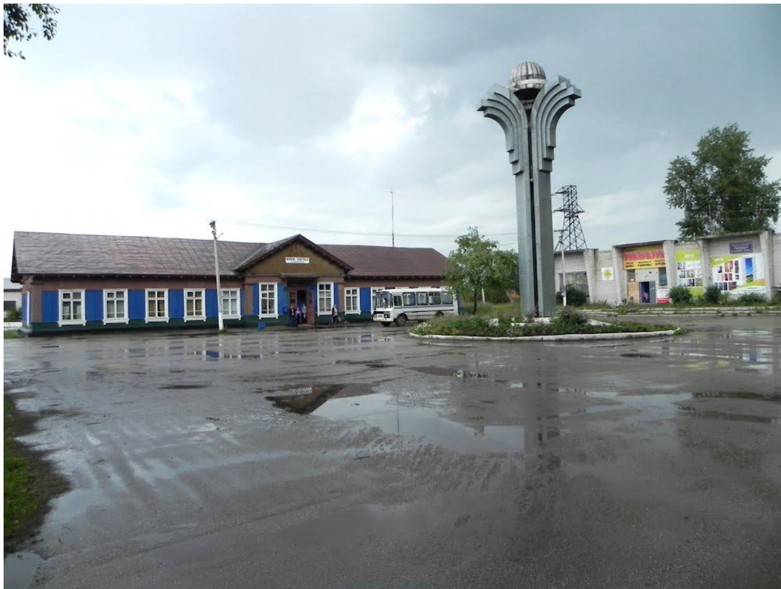
железнодорожный вокзал Княжпогост