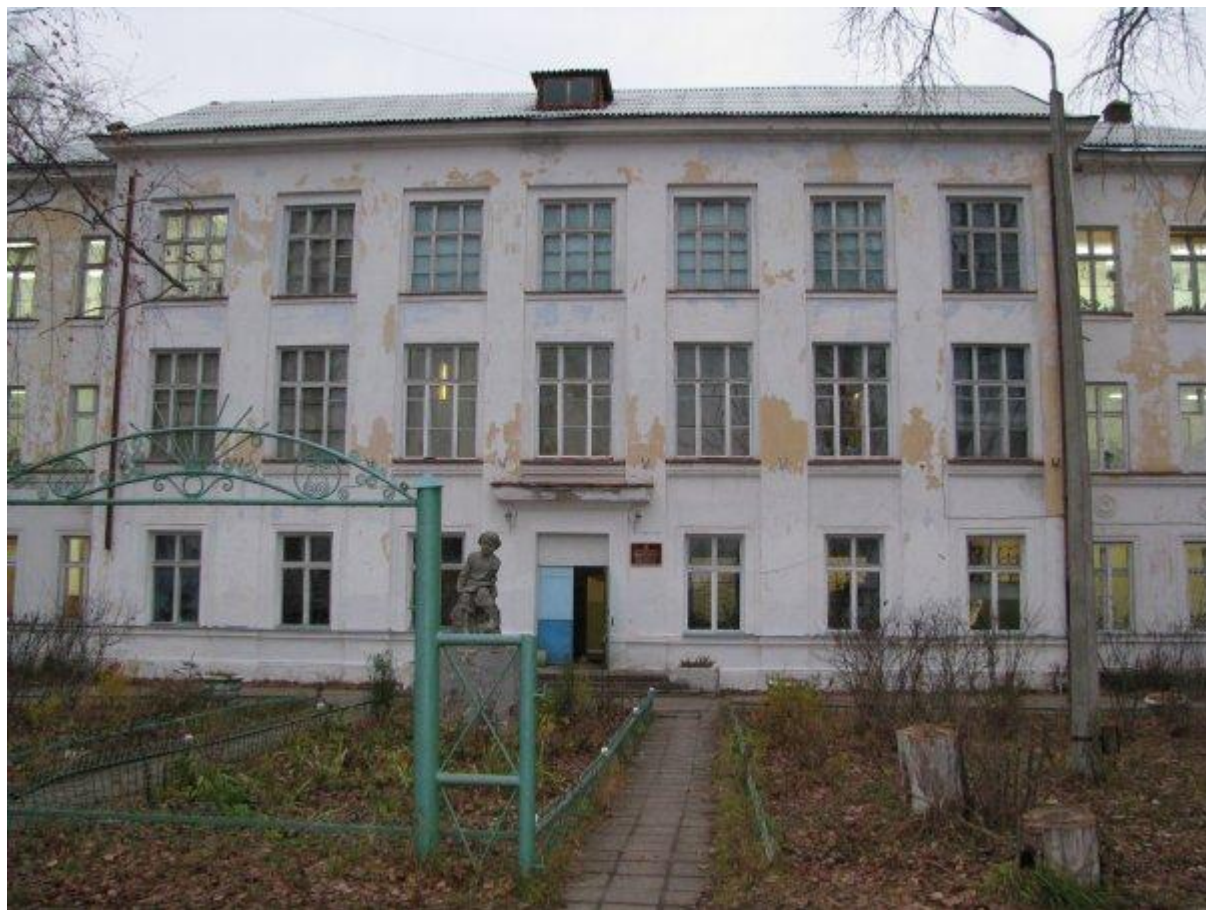
Дом творчества юных