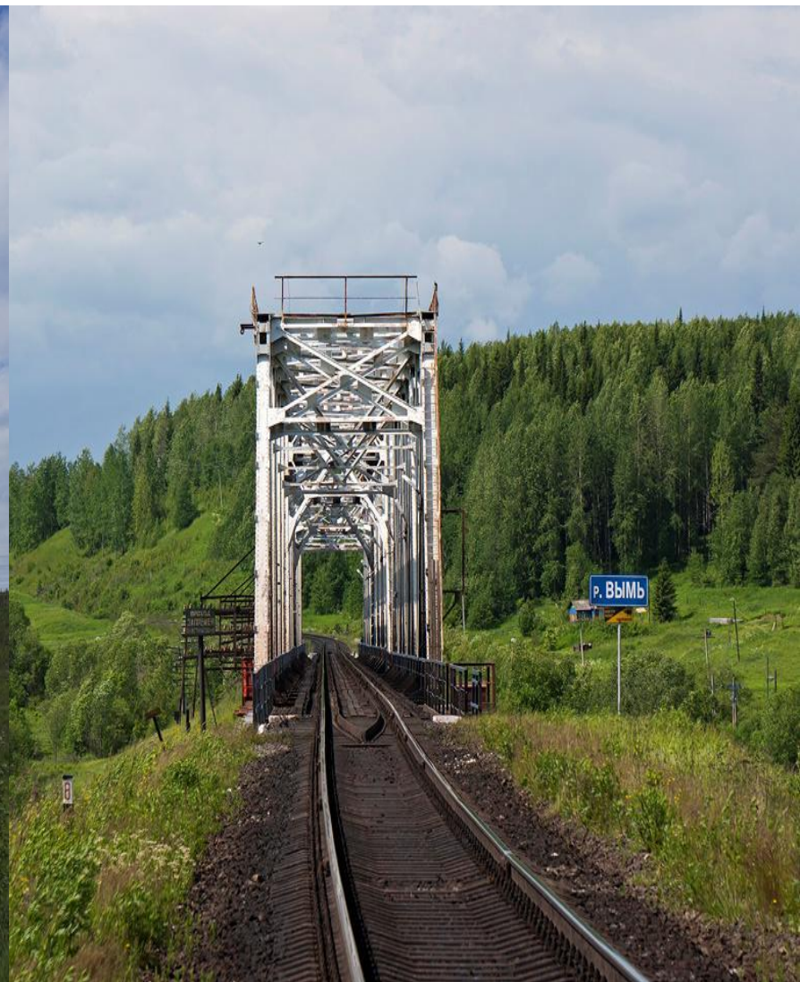
Мост через реку Вымь, перегон Княжпогост - Муська.