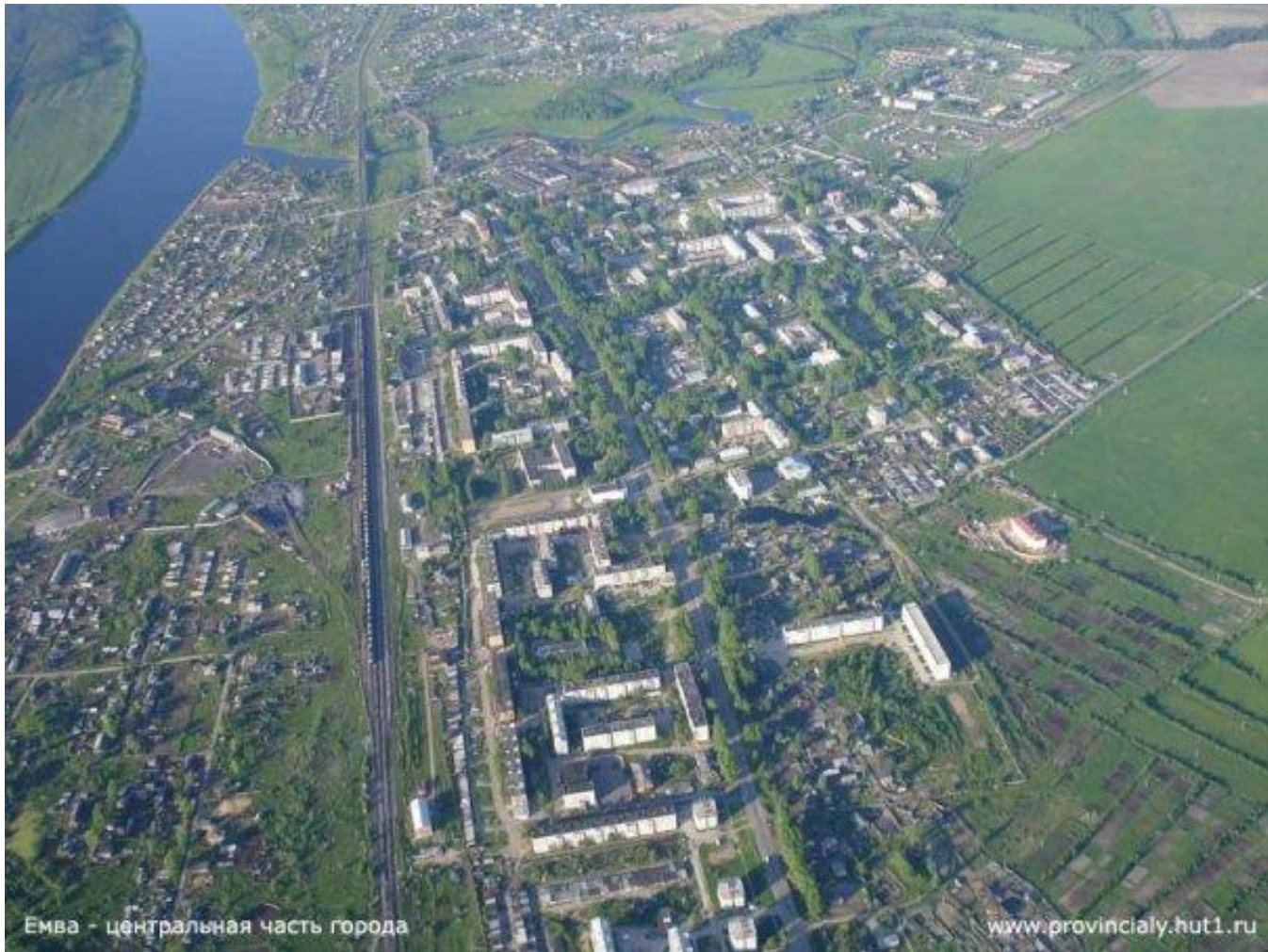
Emva - центральная часть города