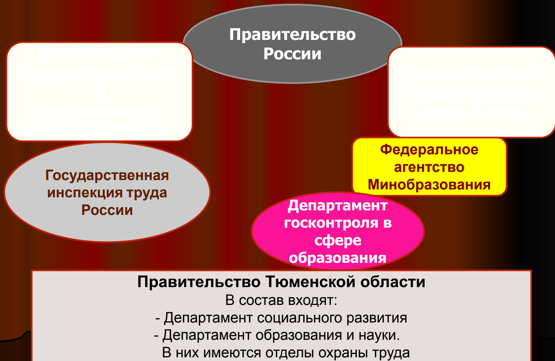
Схема государственного управления охраной труда