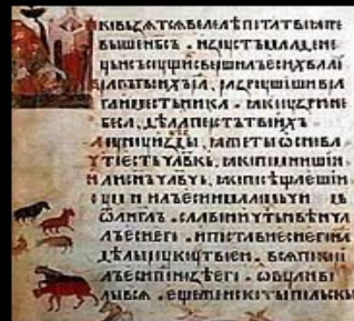
Страница древнерусской рукописной книги « Киевская псалтырь ». 1397.