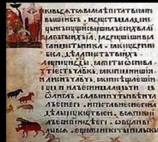
Страница древнерусской рукописной книги « Киевская псалтырь ». 1397.