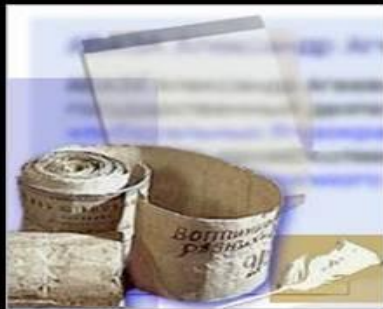
« Слово о полку Изгорева » Величайший памятник древнерусской литературы Конца XII века. Автор неизвестен