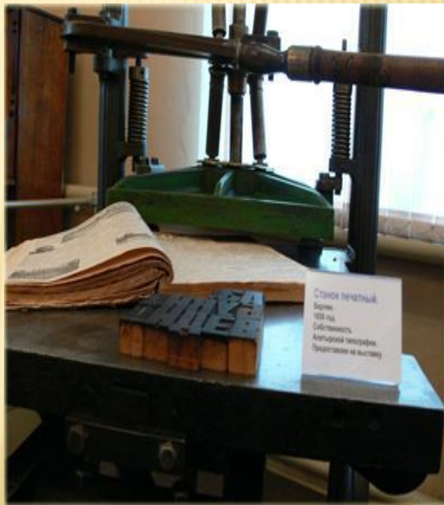
Станок печатный. Вроме 1828 года. Собственность Алтайской библиотеки. Представлен на выставке