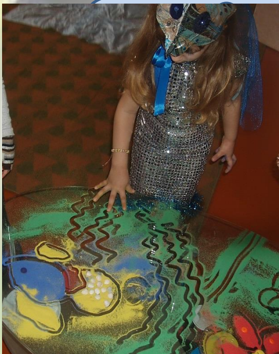
РИСОВАНИЕ ЦВЕТНЫМ ПЕСКОМ