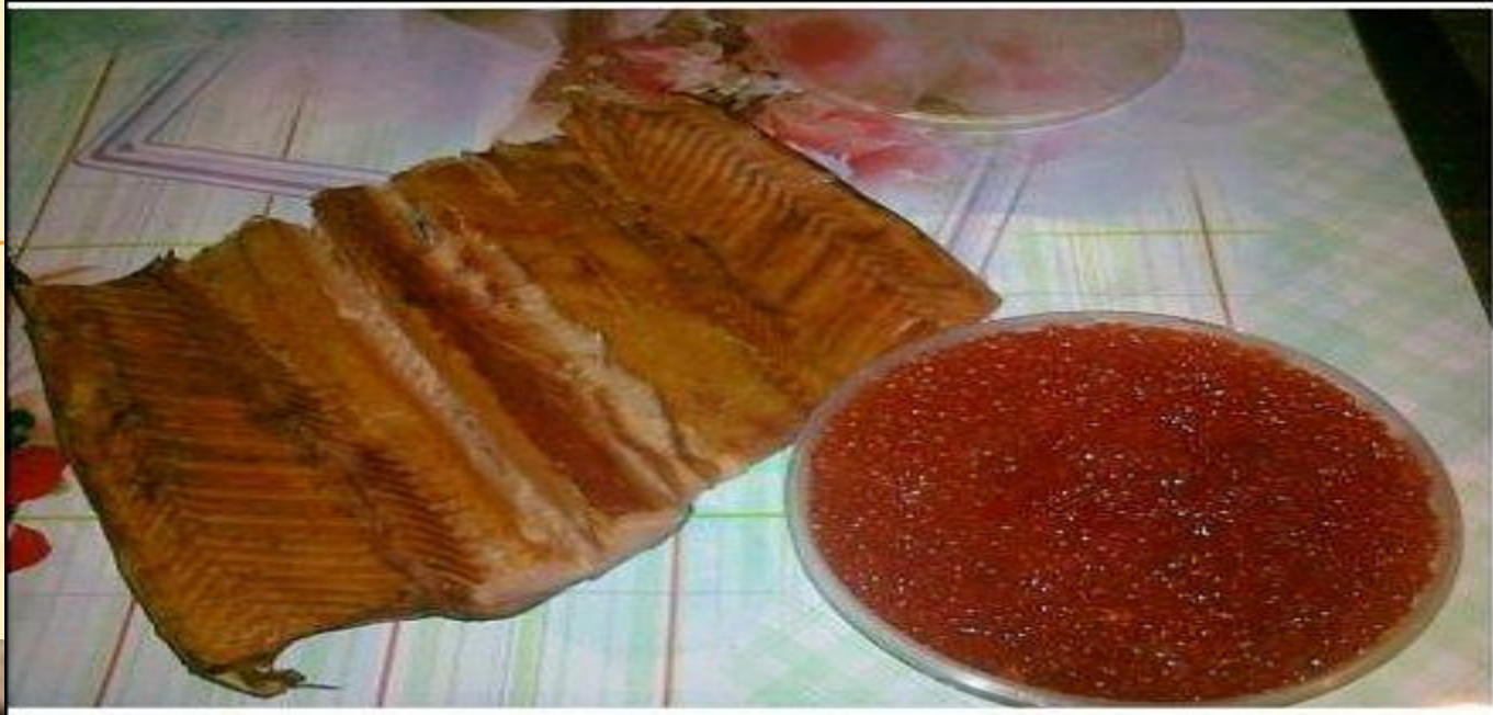
448x336 46kb JPEG