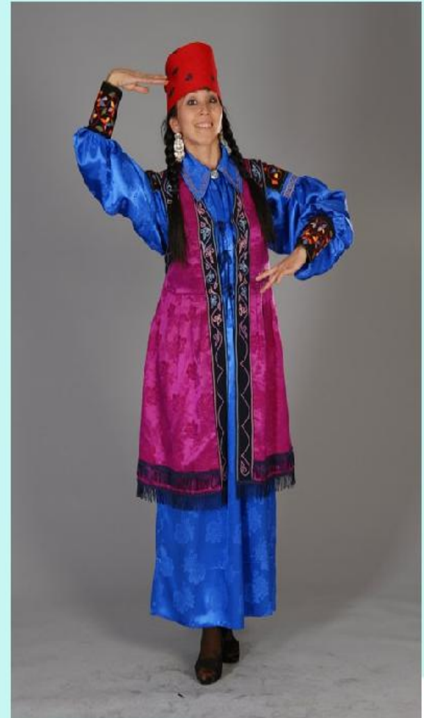
Хакасский национальный костюм