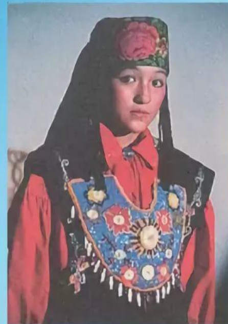
Хакаска в национальной одежде.