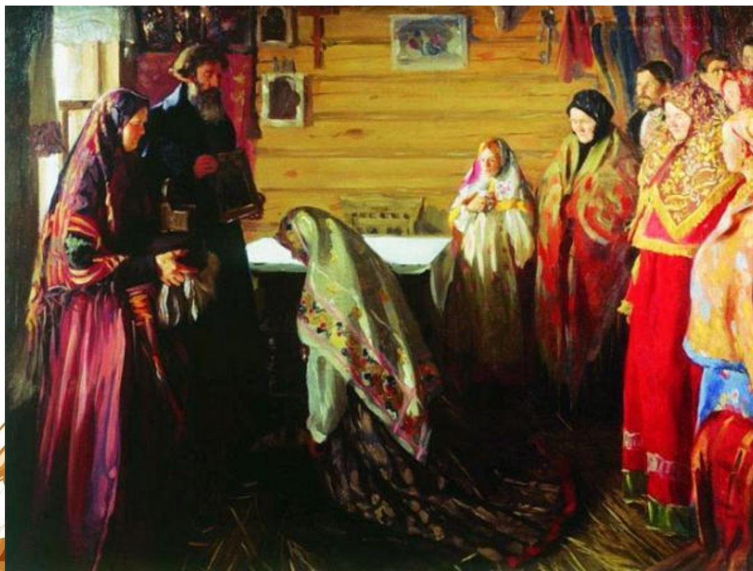
Иван Семёнович Куликов (1875–1941) «Старинный обряд благословения»

Родители благословляли своих детей на брак не только иконой, но и хлебом.