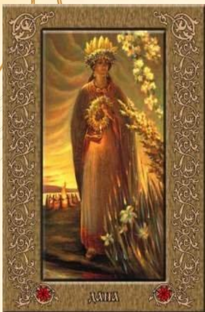
ДАНА – богиня воды.