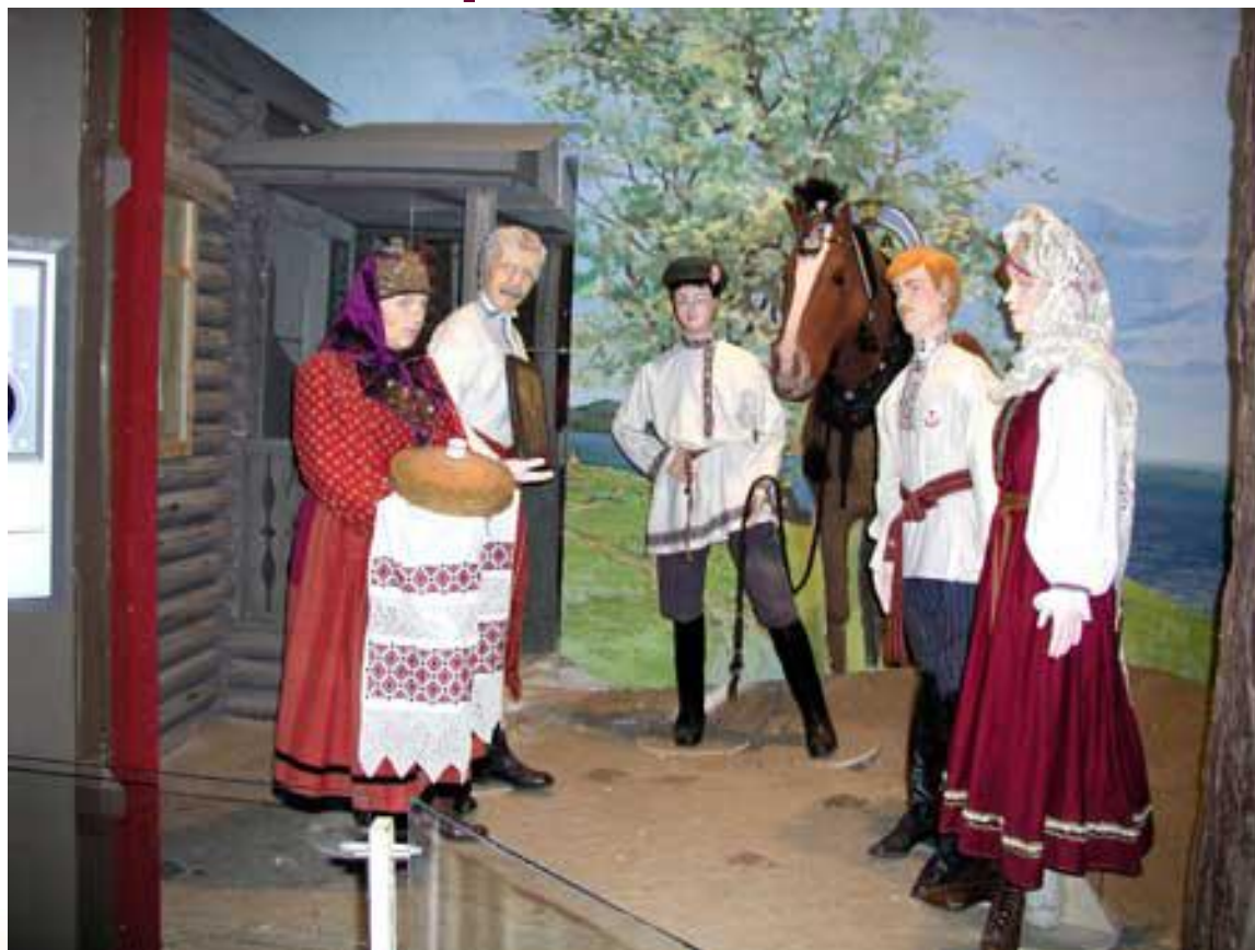
Встреча молодоженов хлебом солью..

После венчания молодых встречали хлебом и солью. Потом этот хлеб везли вместе с приданым невесты.