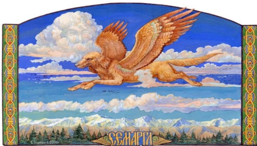
Бог огня Семаргл

Славяне считали, что в приготовлении хлеба участвуют Земля, Огонь и Вода, которых в древности считали Божествами и им поклонялись.