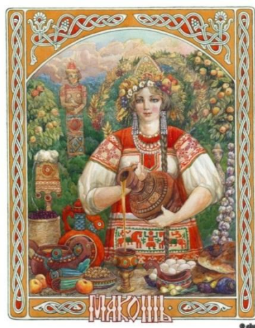
Богиня Земли Макошь