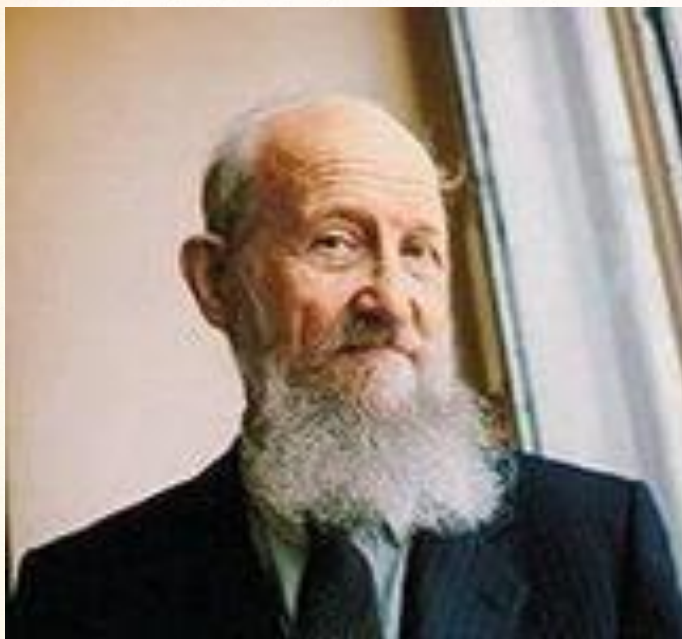
Вильям Васильевич Похлёбкин

По мнению историка В. Похлебкина, блины появились на Руси до IX в., и само слово «блин» - это искаженное слово «млин», берущее начало от слова «МОЛОТЬ».