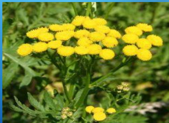
Пижма обыкновенная или дикая