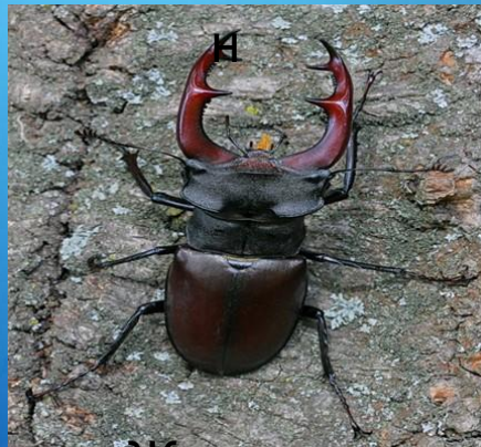
Жук - рогач