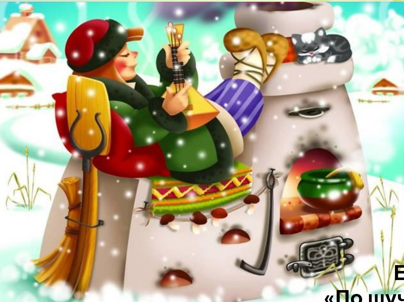
Емеля «По щучьему Веленью»