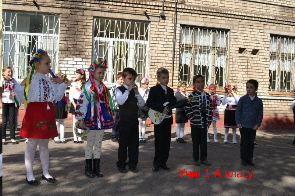
Учні 1-А класу