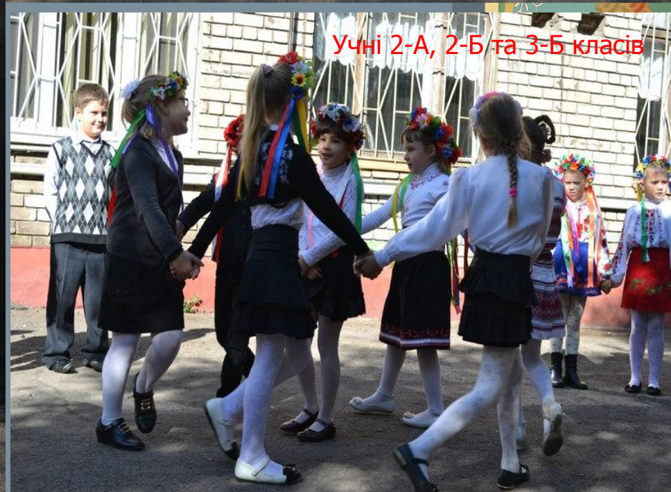
Учні 2-А, 2-Б та 3-Б класів