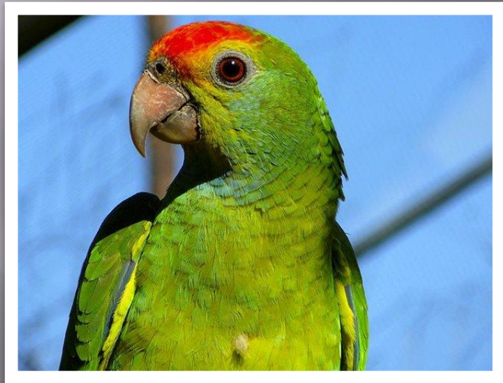
Немного ниже глаз, чуть сзади.