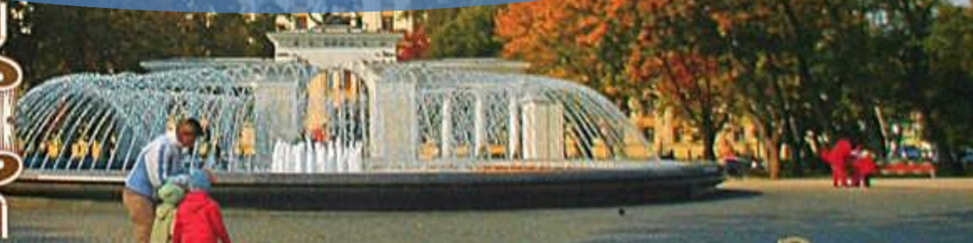
ПАРК ИМЕНИ Г.К. ЖУКОВА ПЕРЕД ЗДАНИЕМ АДМИНИСТРАЦИИ КРАСНОДАРСКОГО КРАЯ

Город Краснодар — крупнейший административный, промышленный и культурный центр Краснодарского края, был основан черноморскими казаками в 1793 г. До 1920 г. назывался Екатеринодаром, в честь русской императрицы Екатерины II. В нем гармонично сочетаются самобытные традиции прошлых лет с ритмом современной жизни.