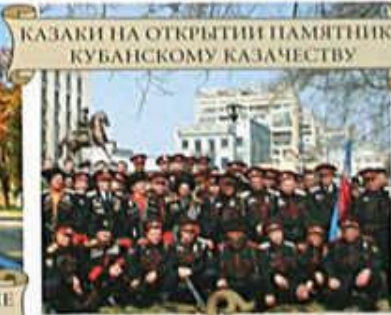
КАЗАКИ НА ОТКРЫТИИ ПАМЯТНИКА КУБАНСКОМУ КАЗАЧЕСТВУ