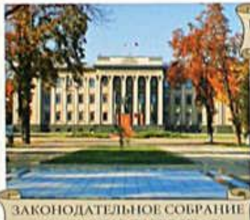
ЗАКОНОДАТЕЛЬНОЕ СОБРАНИЕ КРАСНОДАРСКОГО КРАЯ