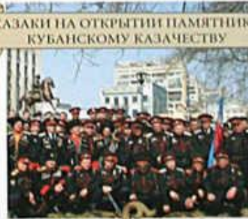
КАЗАКИ НА ОТКРЫТИИ ПАМЯТНИКА КУБАНСКОМУ КАЗАЧЕСТВУ