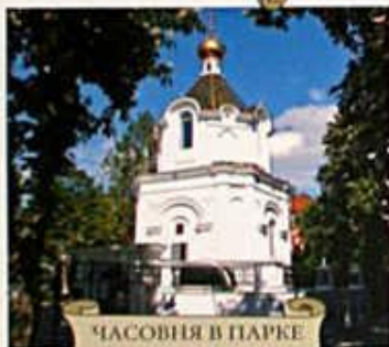
ЧАСОВНЯ В ПАРКЕ ИМ. Г.К. ЖУКОВА

ПАРК ИМЕНИ Г.К. ЖУКОВА ПЕРЕД ЗДАНИЕМ АДМИНИСТРАЦИИ КРАСНОДАРСКОГО КРАЯ