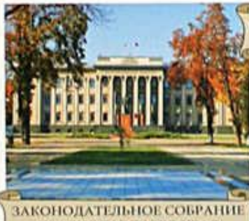
ЗАКОНОДАТЕЛЬНОЕ СОБРАНИЕ КРАСНОДАРСКОГО КРАЯ