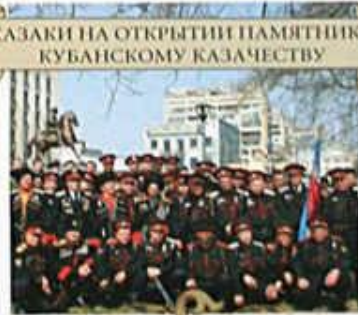
КАЗАКИ НА ОТКРЫТИИ ПАМЯТНИКА КУБАНСКОМУ КАЗАЧЕСТВУ