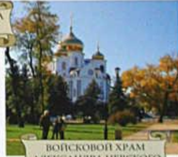
ВОЙСКОВОЙ ХРАМ АЛЕКСАНДРА НЕВСКОГО