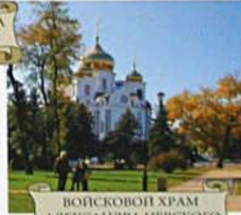
ВОЙСКОВОЙ ХРАМ АЛЕКСАНДРА НЕВСКОГО