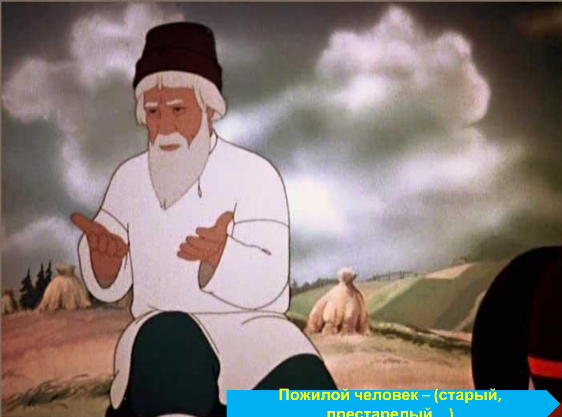
Пожилой человек – (старый, престарелый...)