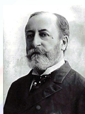
К.Сен - Санс