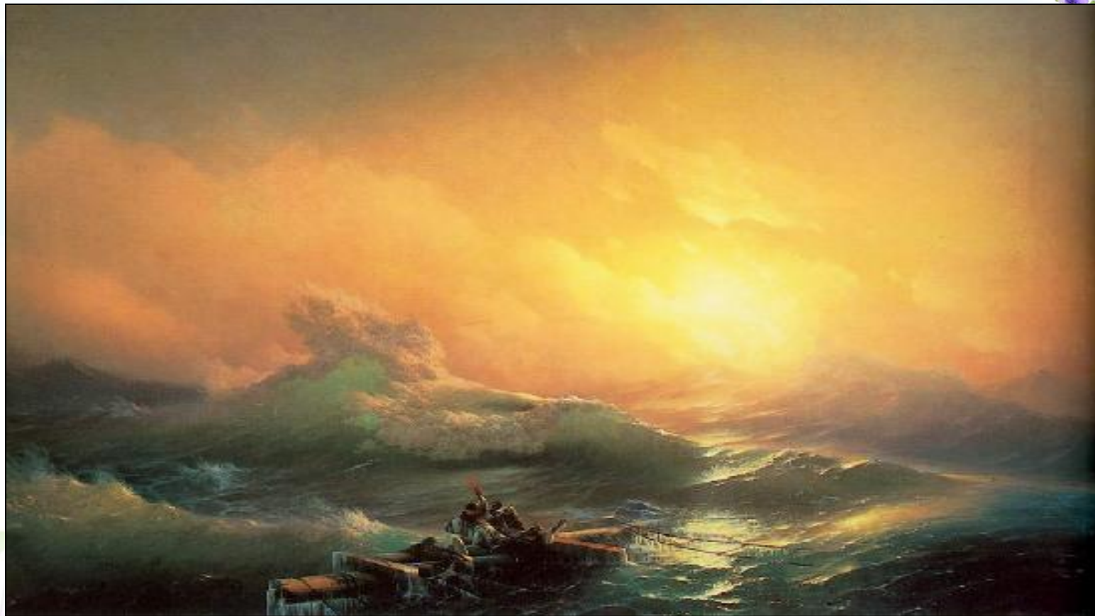
И. Айвазовский «Девятый вал».