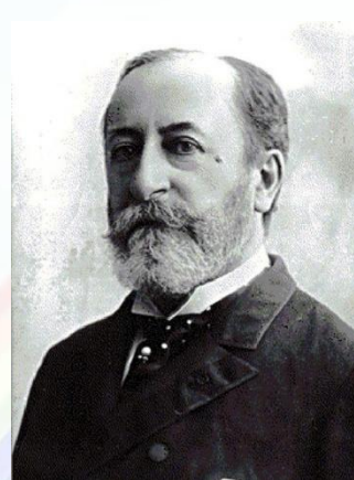
К.Сен - Санс