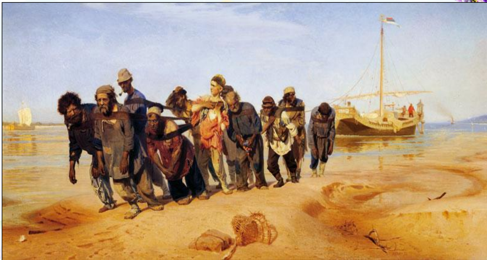
И.Репин «Бурлаки на Волге».