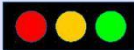
С горизонтальным расположением сигналов