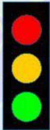
С вертикальным расположением сигналов