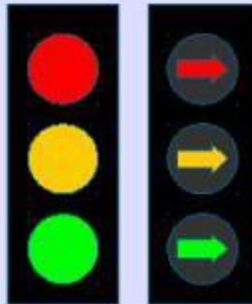
Для регулирования движения в определенных направлениях