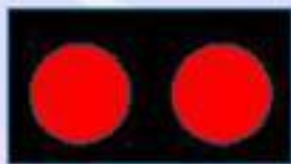
Для регулирования движения через железнодорожные переезды