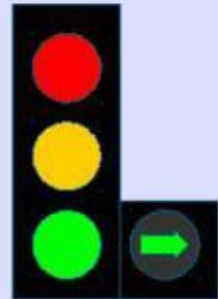
С дополнительной секцией