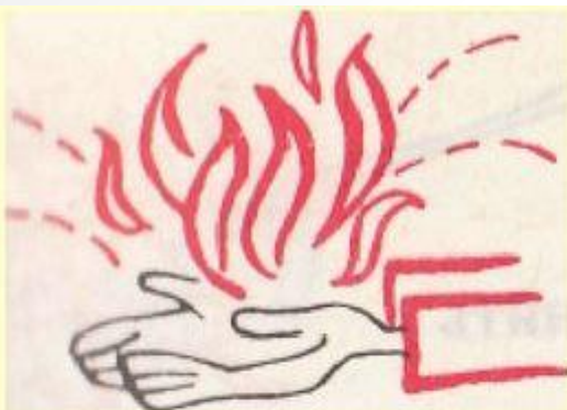
Горит в руках