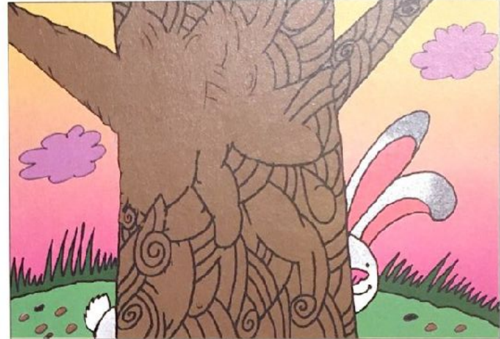
Заяц выглядывает из-за дерева.