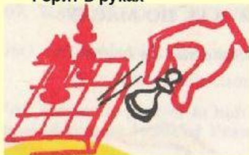
Как рукой сняло