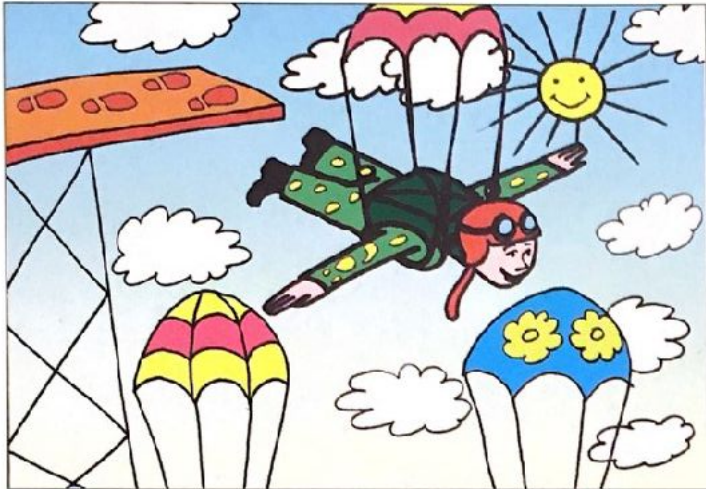
Парашютист прыгает с вышки.