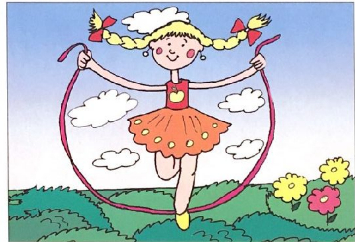
Девочка прыгает через верёвочку.