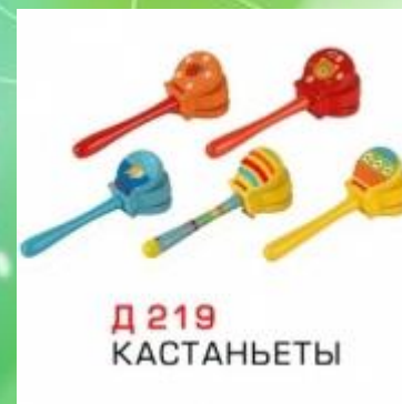
Д 219 КАСТАНЬЕТЫ