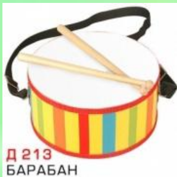
Д 213 БАРАБАН