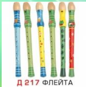
Д 217 ФЛЕЙТА