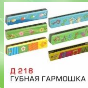
Д 218 ГУБНАЯ ГАРМОШКА