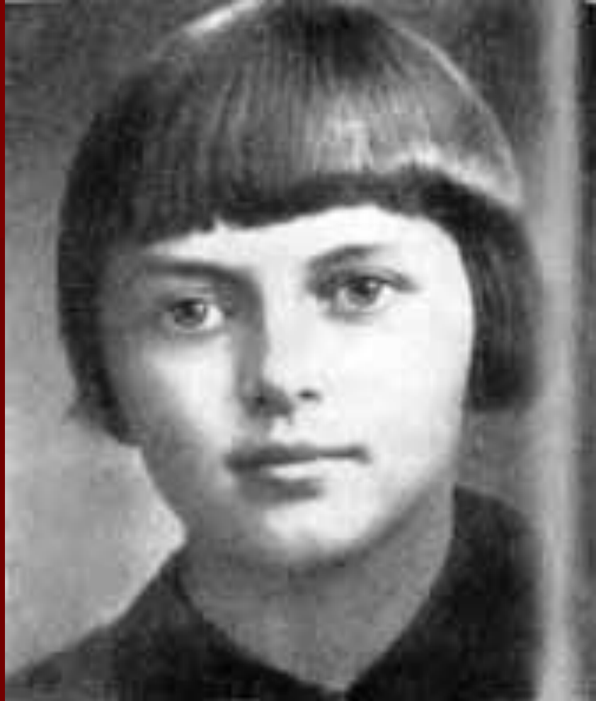
Портнова Зинаида Мартыновна (1926-1944)

С 1942 года С 1942 года член подпольной организации « Юные мстители ». В подполье была принята в ВЛКСМ .