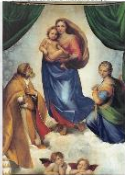
Рафаэль Санти "Святая Мадонна и Младенец"