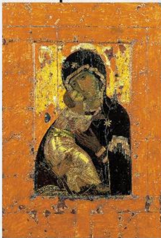
Владимирская икона Божией Матери

По церковному преданию, икону написал евангелист Лука на доске стола, за которым трапезничал Христос с Марией и Иосифом. Это тип иконы называется «Елеуса» («Умиление»). Здесь подчеркивается естественное человеческое чувство, материнская любовь и нежность. Это образ матери, глубоко скорбящей о предстоящих страданиях сына и в молчании переживающей их неизбежность.