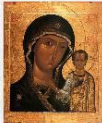
Казанская икона Божией Матери