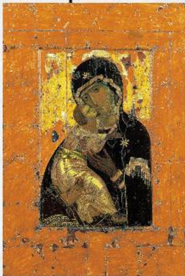
Владимирская икона Божией Матери

• По церковному преданию, икону написал евангелист Лука на доске стола, за которым трапезничал Христос с Марией и Иосифом. Это тип иконы называется «Елеуса» («Умиление»). Здесь подчеркивается естественное человеческое чувство, материнская любовь и нежность. Это образ матери, глубоко скорбящей о предстоящих страданиях сына и в молчании переживающей их неизбежность.