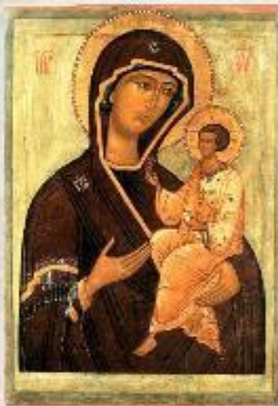
Тихвинская икона Божией Матери