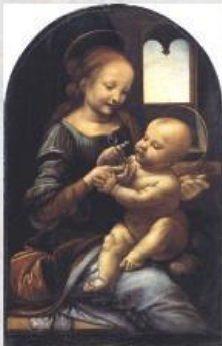
Леонардо да Винчи "Мадонна Белли"