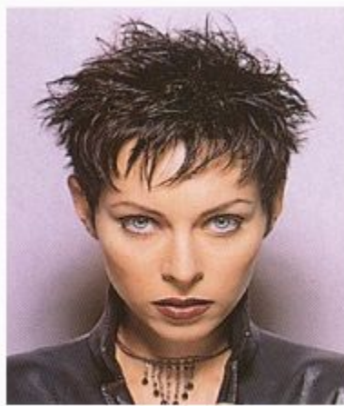
Большое количество лака