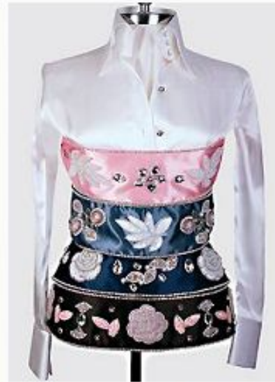
Стразы, бисер, яркий декор