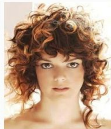
Не фиксированная форма