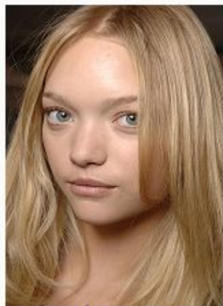
Длинные, распущенные волосы