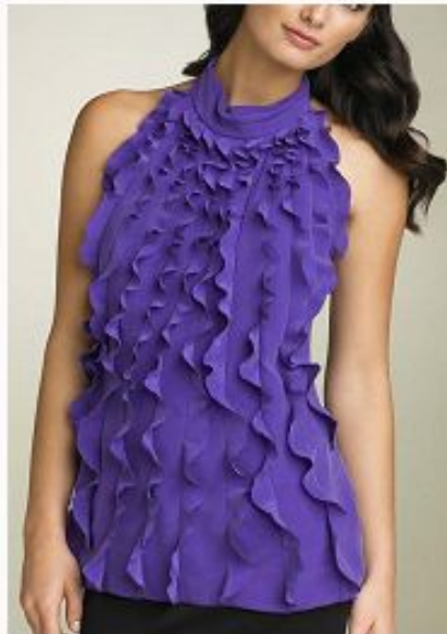
Яркие цвета, рюши