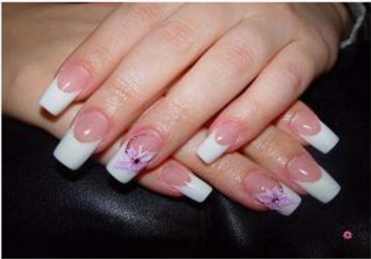
Маникюр со стразами и рисунком