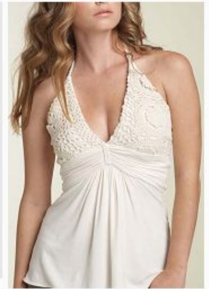
Глубокий вырез, топы на бретельках