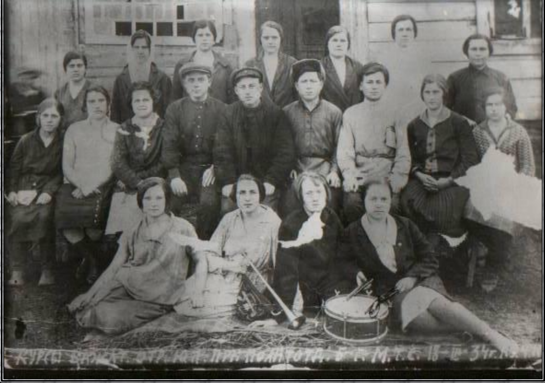
Курсы вожатых пионерских отрядов при политотделе Белоглинской МТС. 18. 03. 1934 года.