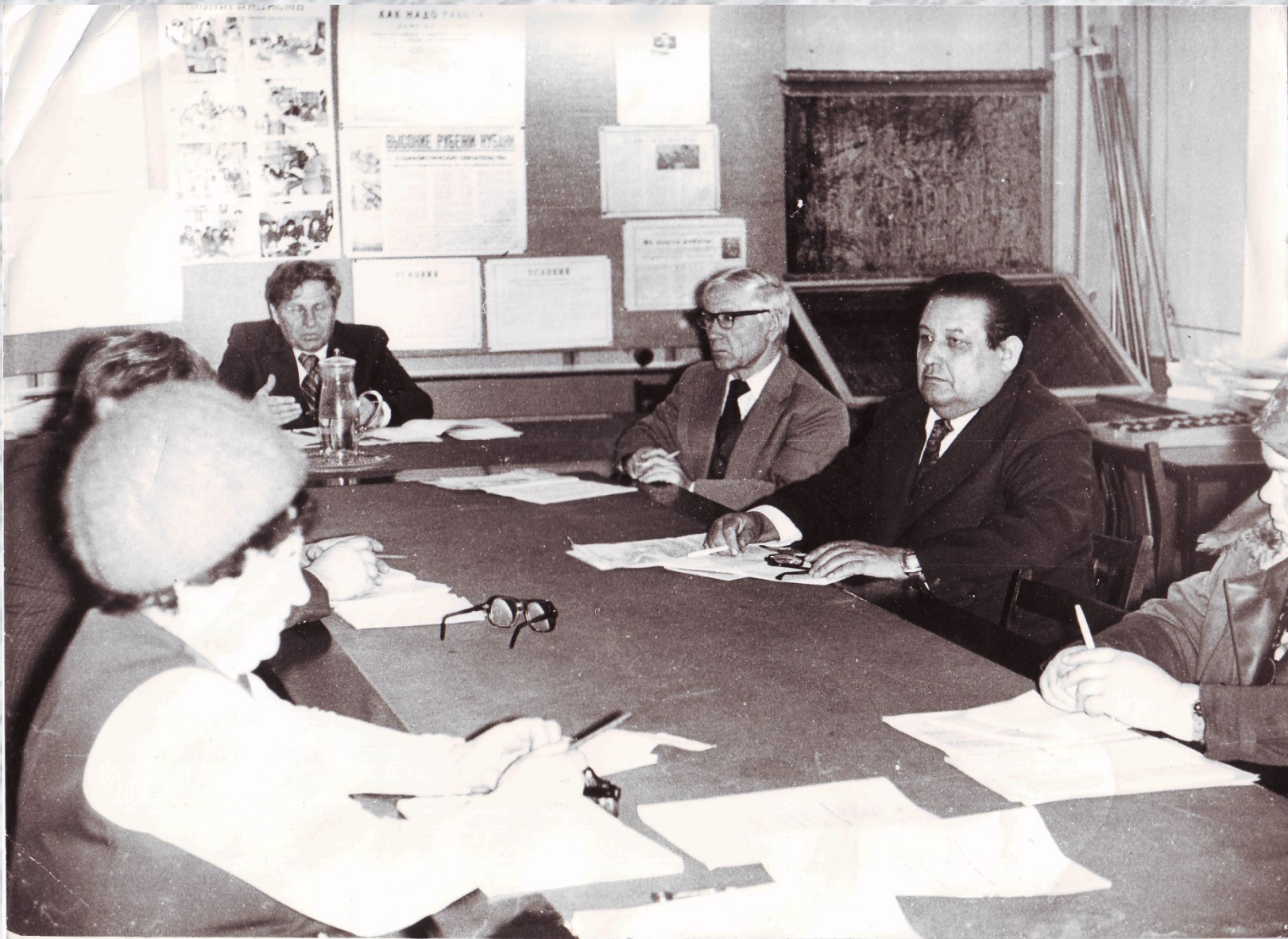
На заседании правления колхоза.