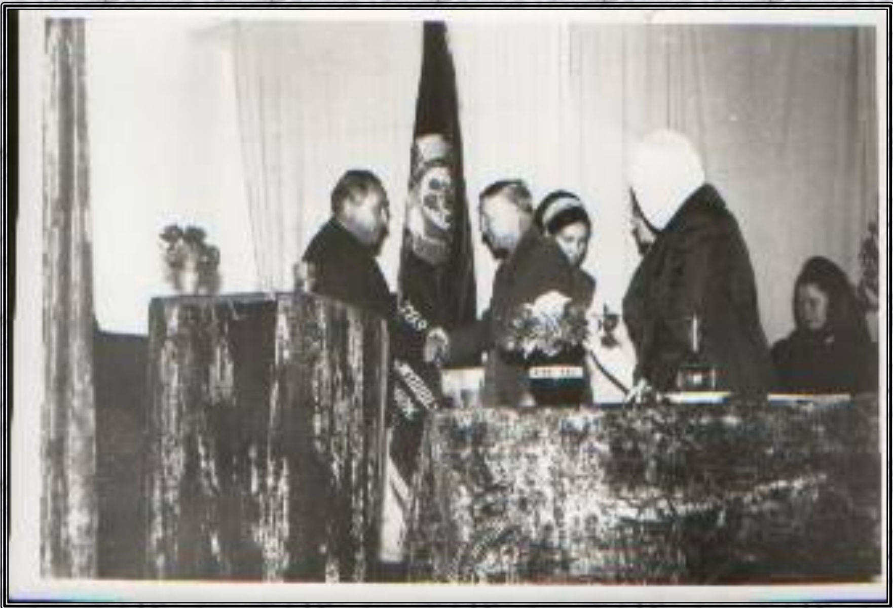
Вручение колхозу переходящего Красного Знамени.