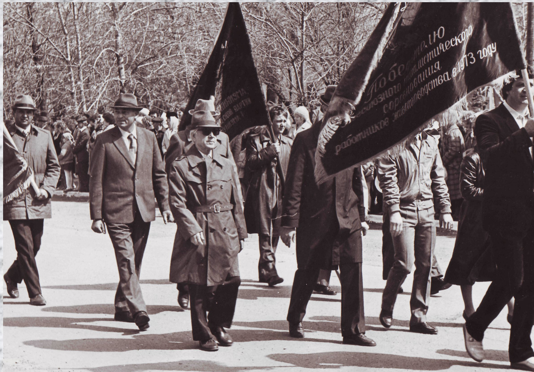
Колхоз имени Ленина на демонстрации.