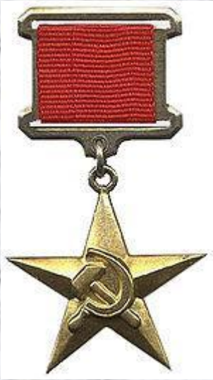
Золотая медаль «Серп и Молот» — атрибут Героя Социалистическог о Труда