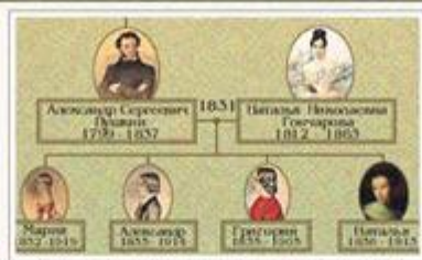
Родословная А.С. Пушкина в портретах