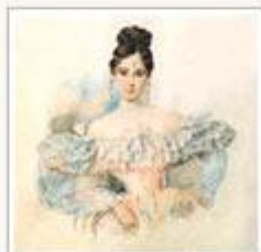
А.П. Брюллов. Н.Н. Пушкина. Конец 1831 - начало 1832 года. [ВМГ]