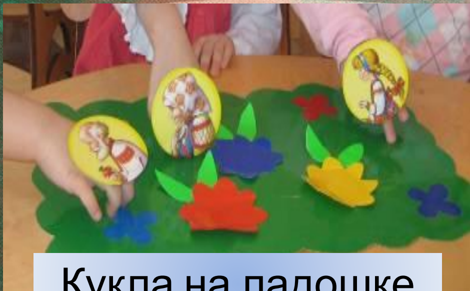
Кукла на ладошке