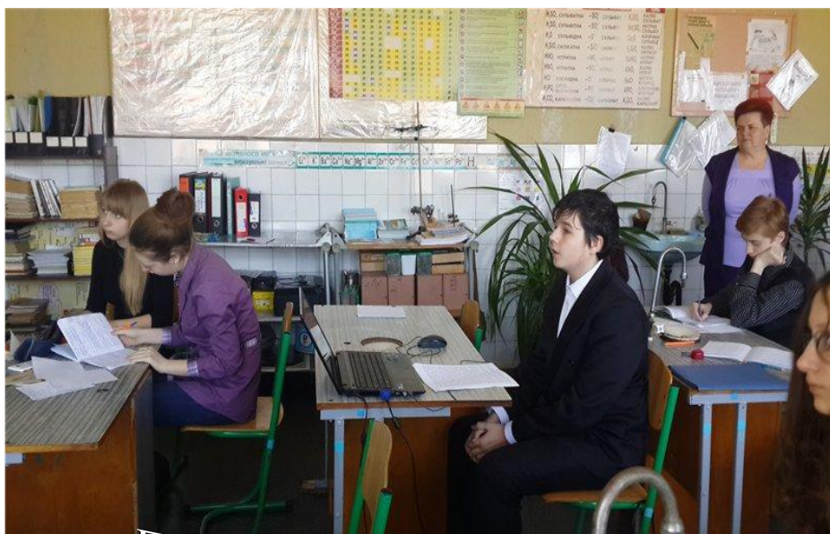
Предпрофильная подготовка 8-9 классов