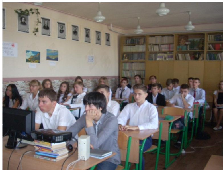
Профильная подготовка 10-11 классов