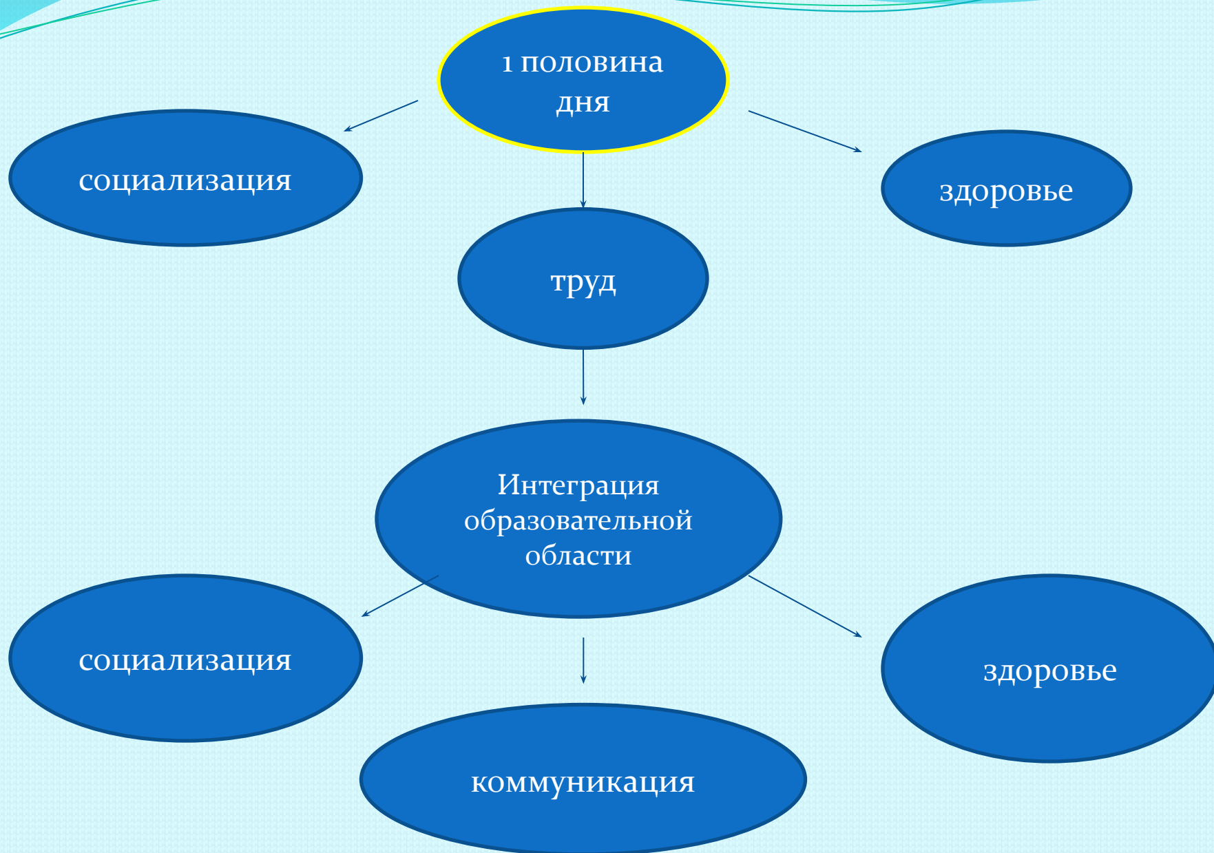
Схема интегрированного дня в МБДОУ соответствующая ФГТ.