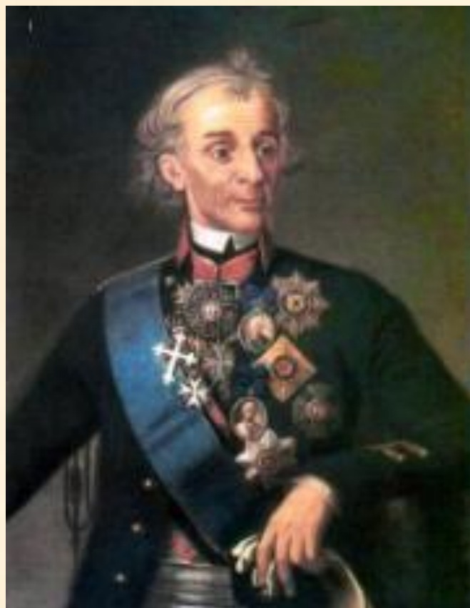
Александр Васильевич Суворов