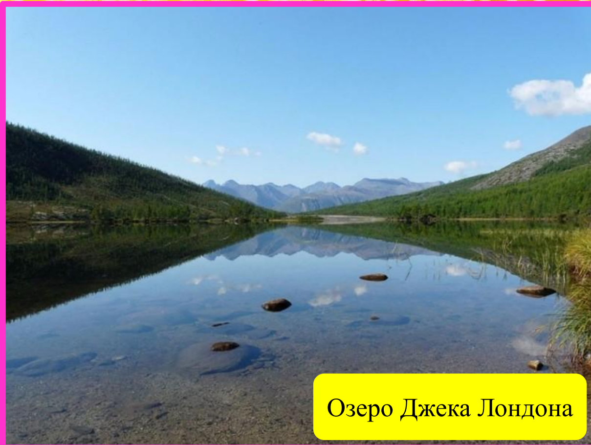
Озеро Джека Лондона