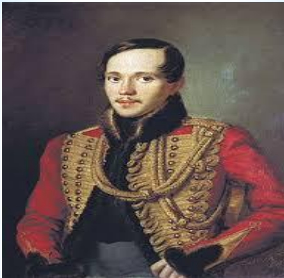
М. Ю. Лермонтов