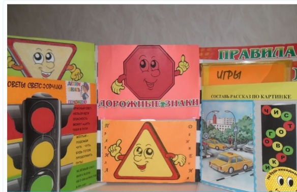
Лэпбук по ПДД