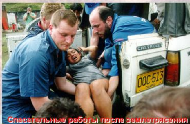
Спасательные работы после землетрясения