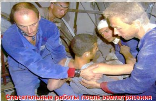
Спасательные работы после землетрясения

Чрезвычайную ситуацию порой можно предвидеть, но чаще всего она возникает внезапно.