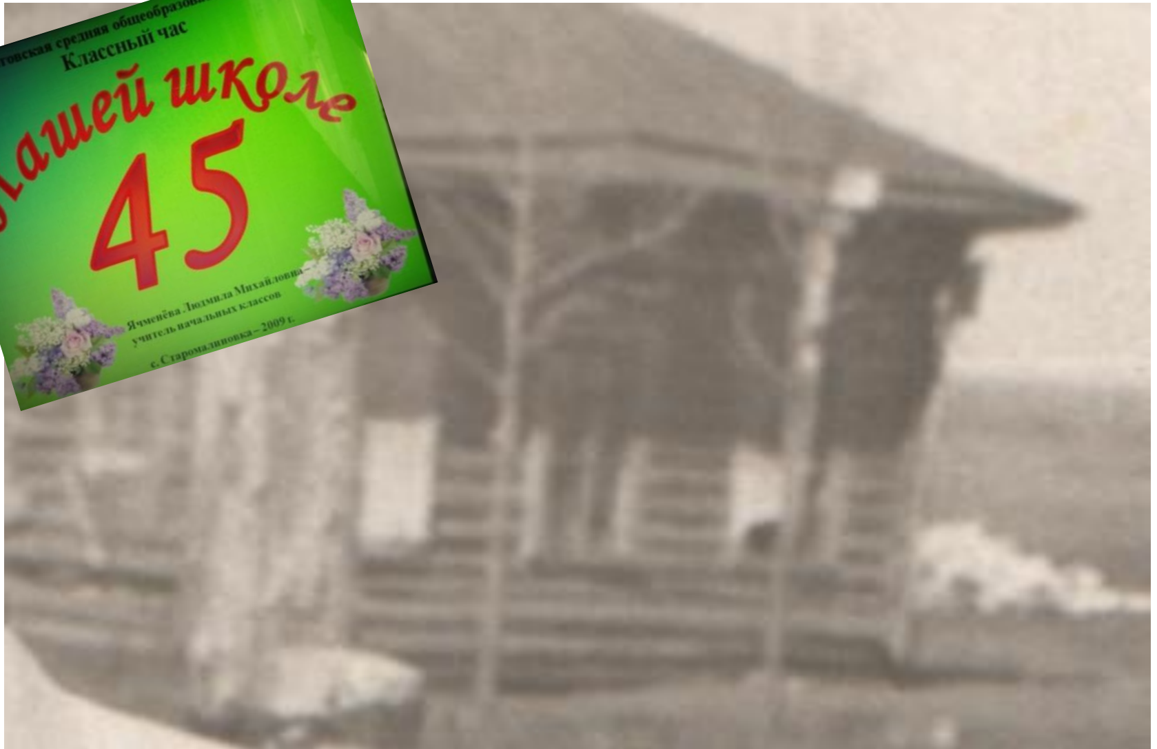
Начальная школа с. Старомалиновка