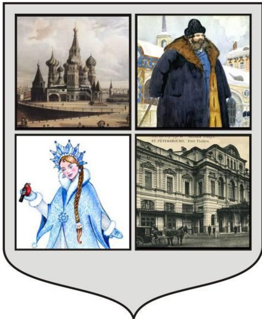
Проект герба А.Н. Островского