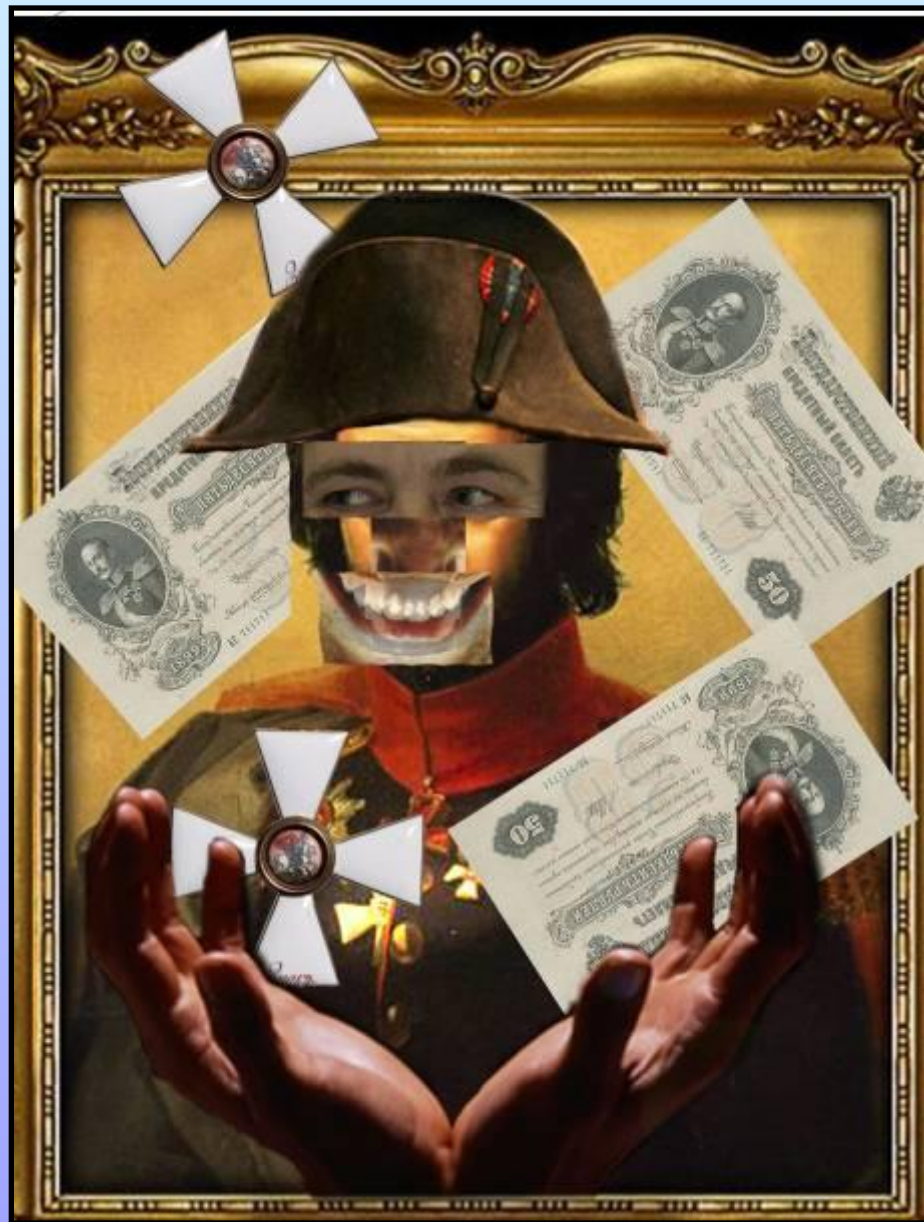
Портрет-коллаж полковника Скалозуба. Автор М. Ануфриева