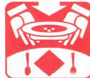
Накрывать на стол