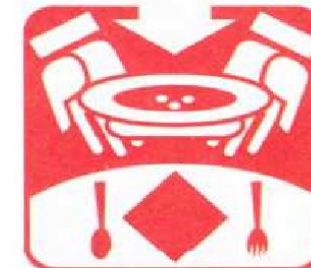
Накрывать на стол