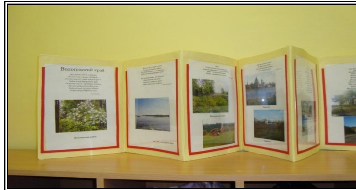
Ширма «Вологодский край!»