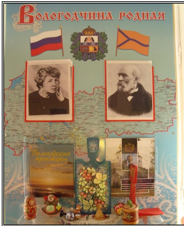
Стенд в группе