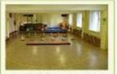
МБ ДОУ "Детский сад №17"