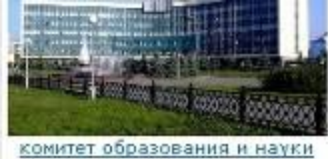
КОМИТЕТ ОБРАЗОВАНИЯ И НАУКИ