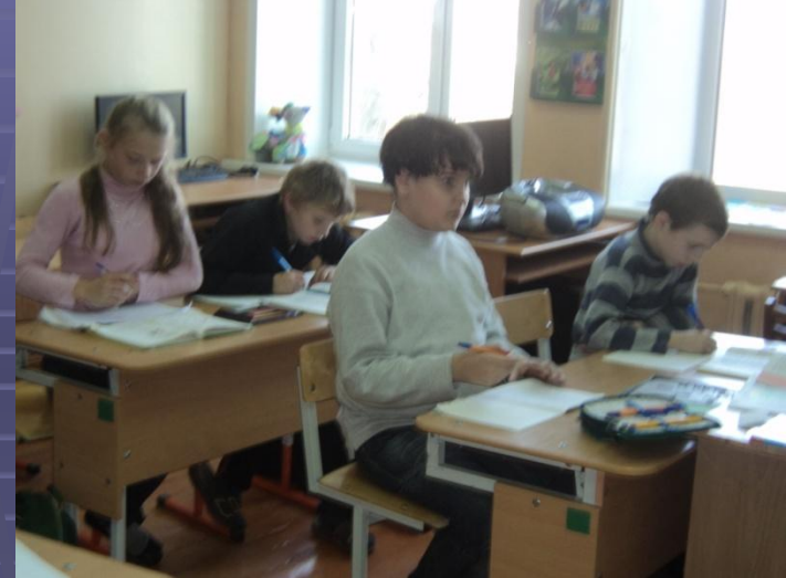
форма обучения учащихся аутистов