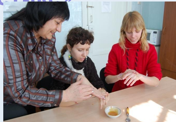
Нанесение маски на руки