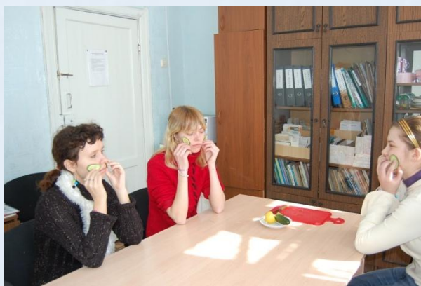
Из свежих огурцов делают маски, они осветляют загар, отбеливают кожу, делают ее эластичной.