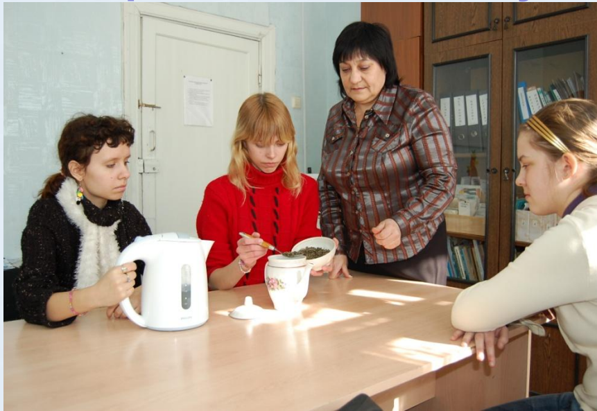
Приготовление общеукрепляющего чая

На уроках домоводства, изучая тему «Целебное питание», учащиеся знакомятся с понятием «фитотерапия», учатся с помощью литературы находить рецепты применения фиточая, а на практических занятиях готовят простые всем доступные полезные чаи.