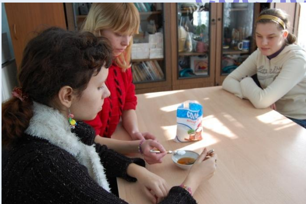
Приготовление медовой маски для рук