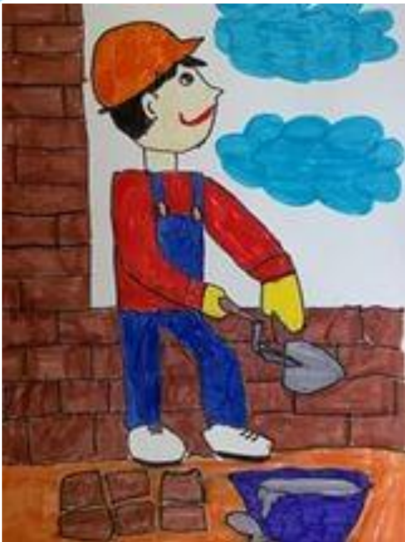
рисунок Якунина Юры