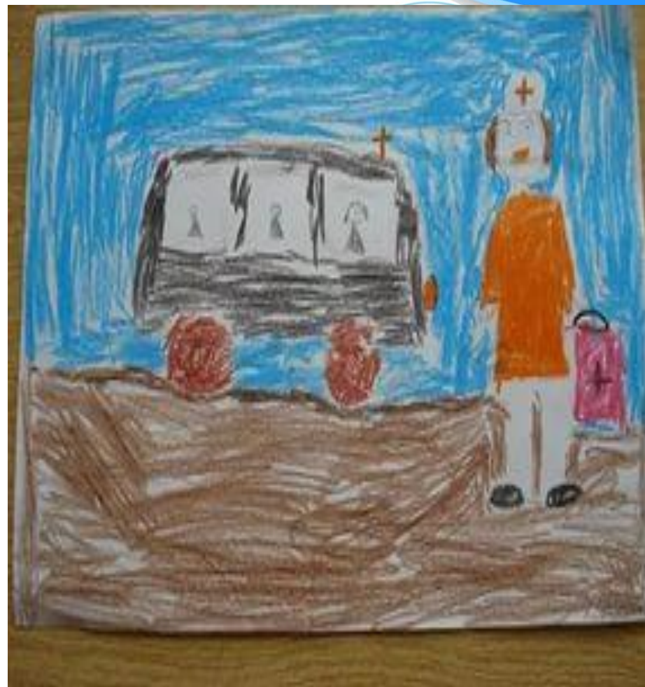
рисунок Чехуты Маши

Если щёки запылают Вдруг сильнее кумача, Если кашель – вызывают Всем немедленно врача. Выпишет он нам пилюли. Травок этих, травок тех, Чтоб назавтра мы проснулись Сразу здоровее всех. Ну а если будет нужно – Тут же сделает укол, Чтоб скорей с командой дружной Вновь играли мы в футбол.