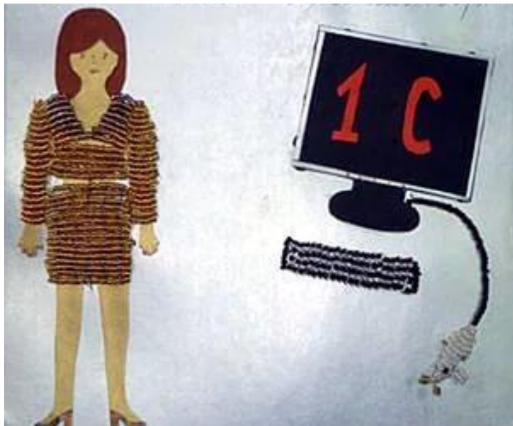
рисунок Курца Димы