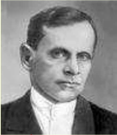
педагог и психолог, ведущий теоретик педологии

Построить педагогический процесс нельзя без знания: