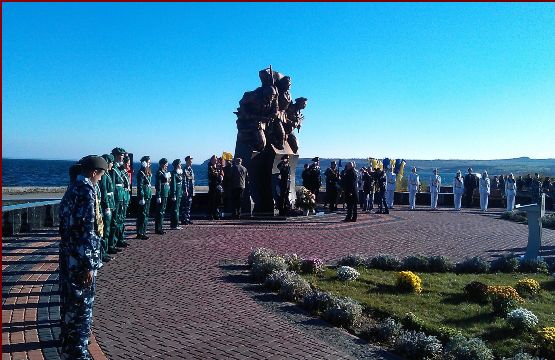
Открытие памятника героям-эльтигенцам