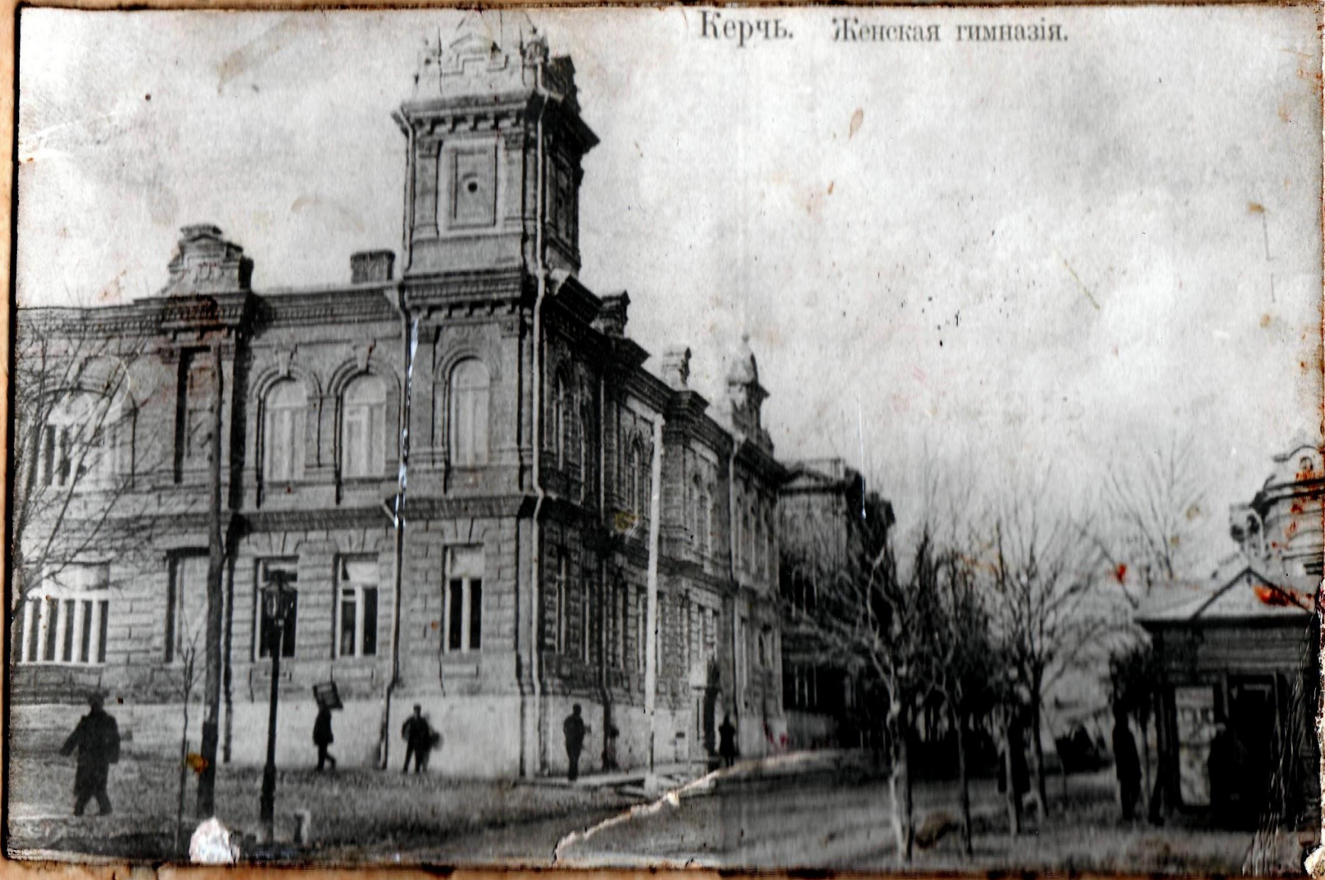
Керчь. Женская гимназія.