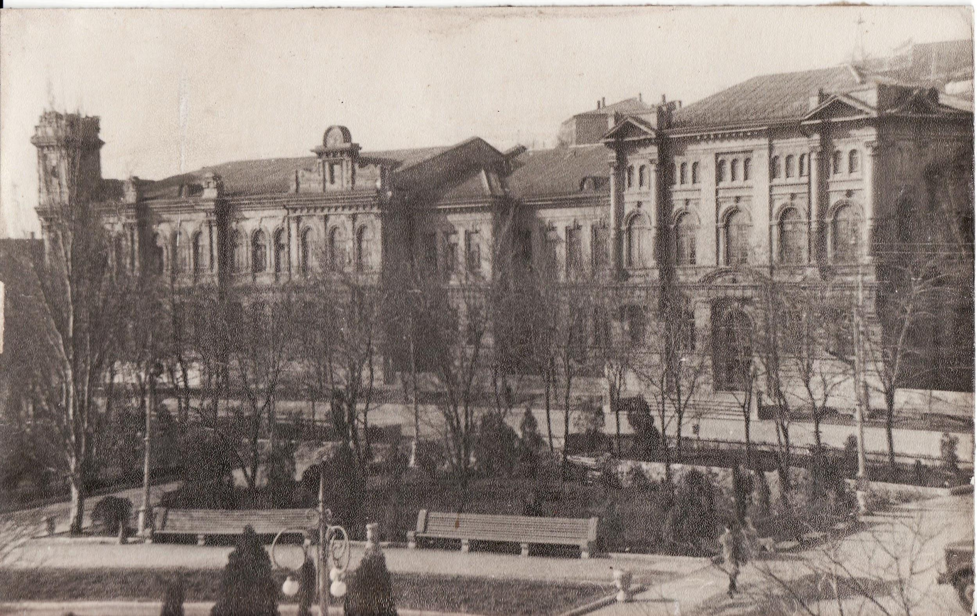
Школа. 1957 год.