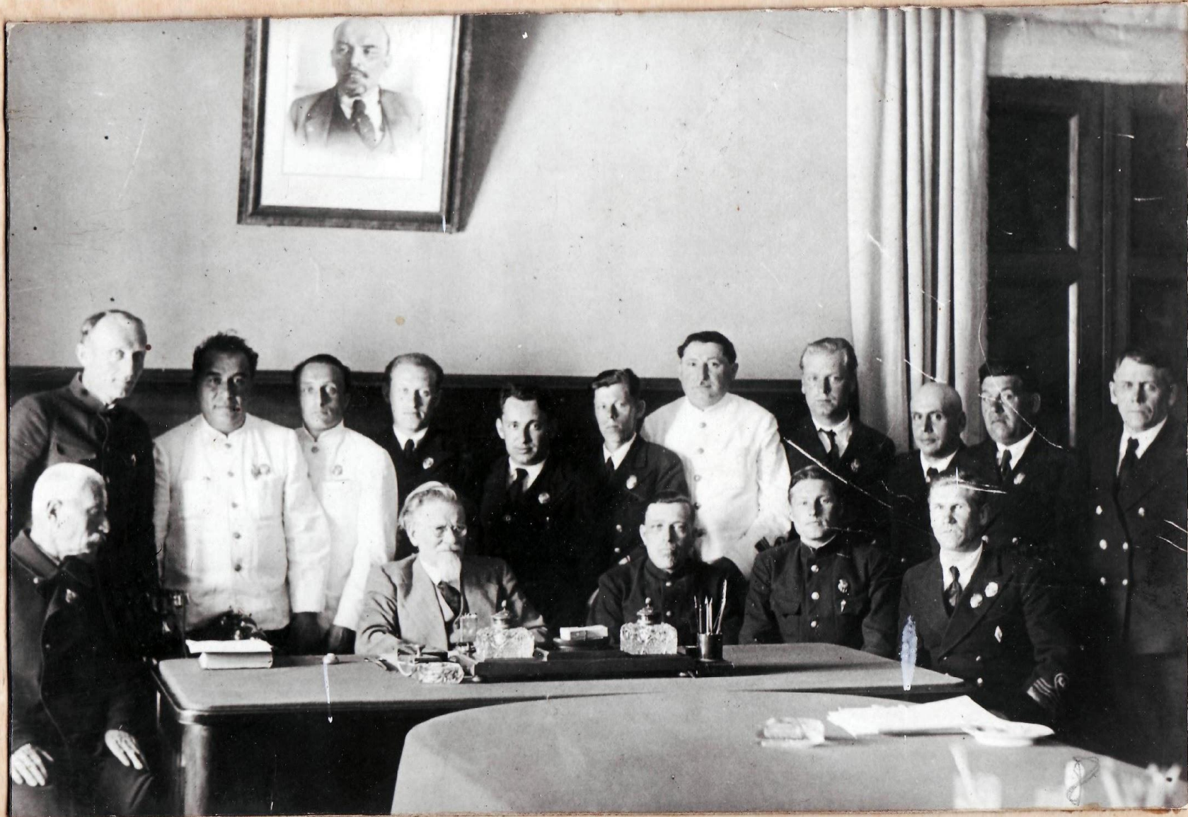
ВЫПУСКНИК ШКОЛЫ ЗАВГОРОДНИЙ ЕИ. НА ПРИЕМЕ У МИХАИЛА ИВАНОВИЧА КАЛИНИНА