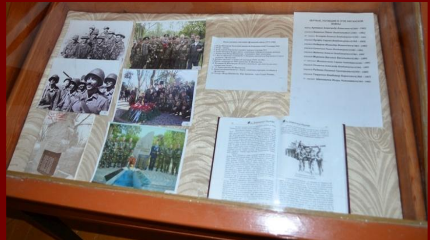
Экспонаты в школьном музее