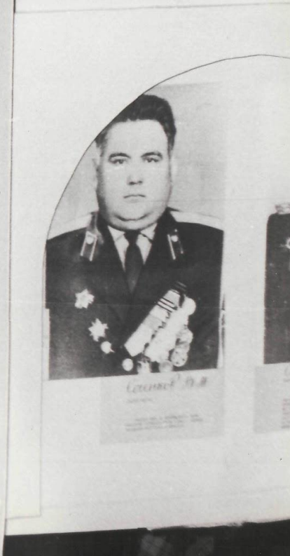
В школьном музее