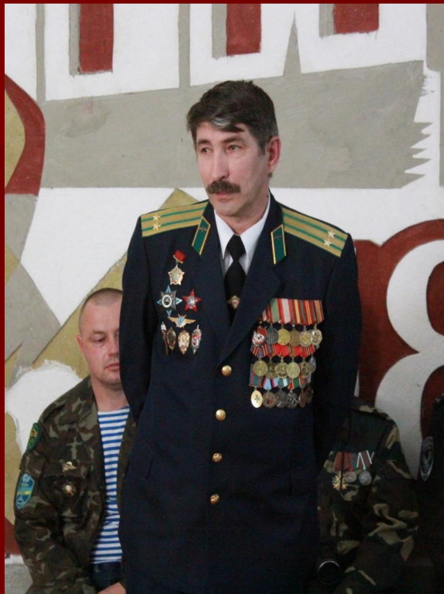
Праздник белых журавлей