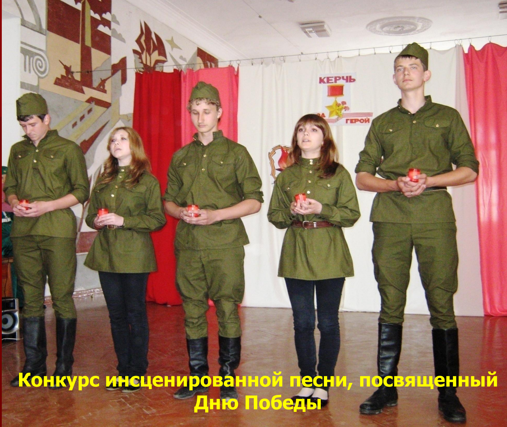
Конкурс инсценированной песни, посвященный Дню Победы