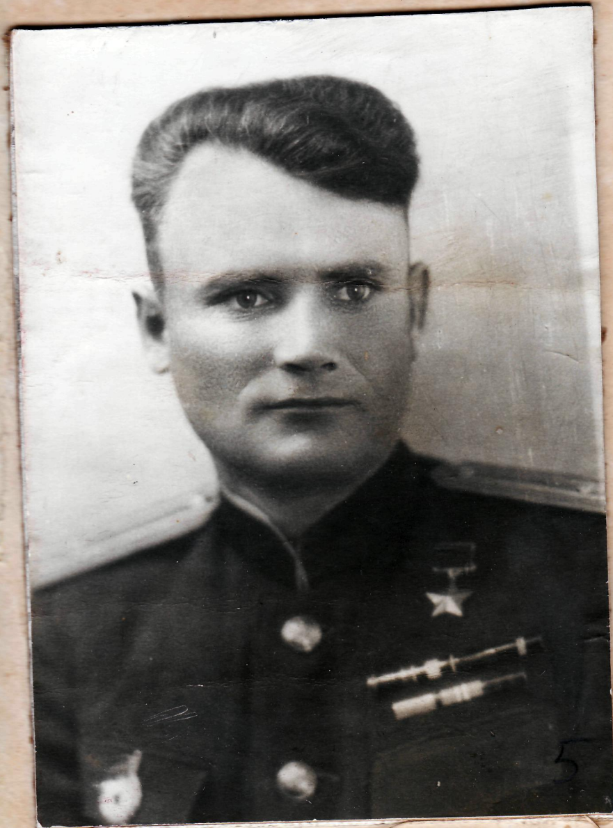
ПУШКАРЕНКО А.-ГЕРОЙ СОВЕТСКОГО СОЮЗА