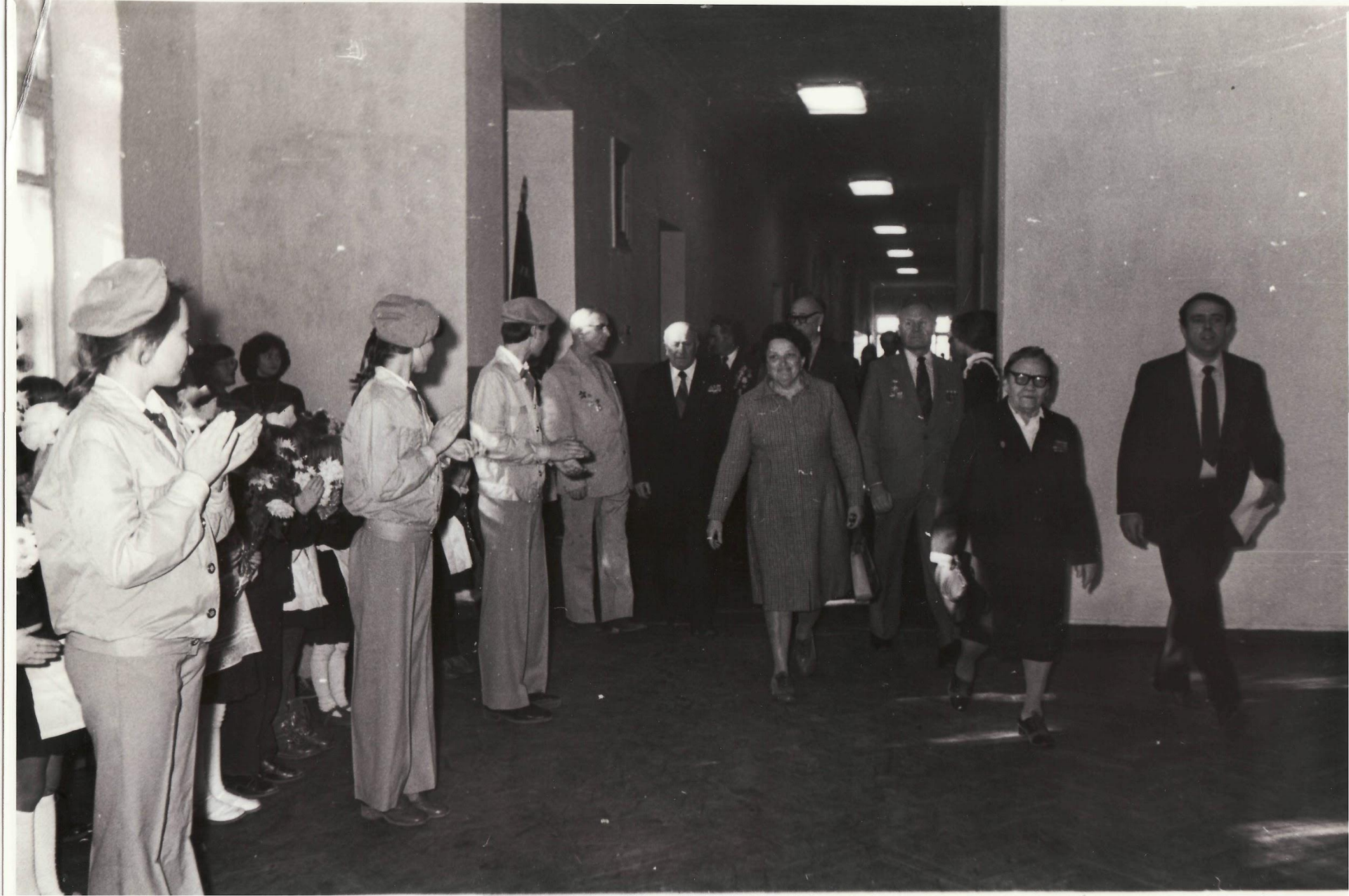
Линейка, посвященная открытию школьного музея