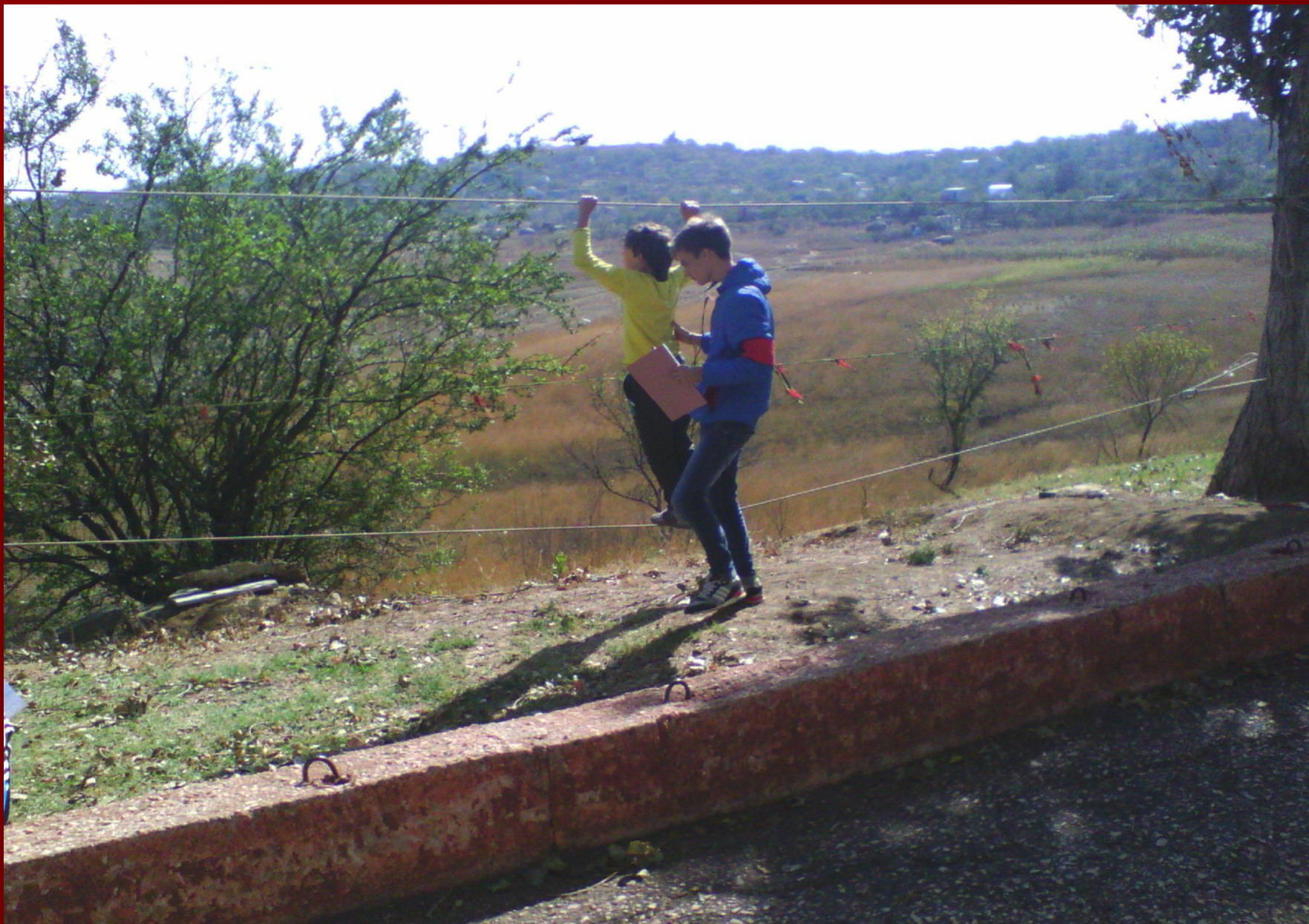
Военно-спортивная игра «Зарница»